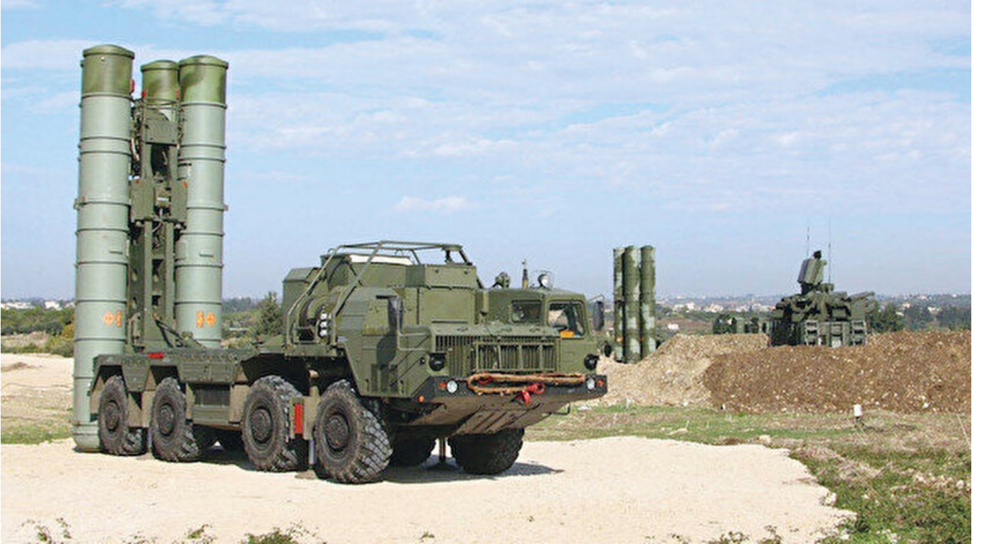
S-400 hava savunma sistemi

Kıymet Sezer · 06 Temmuz 2019, 04:00 · Yeni Şafak