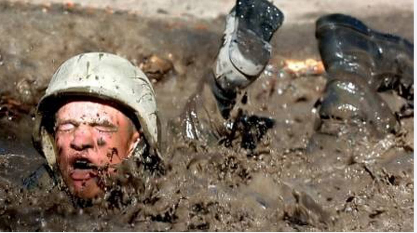
Şok mangası adı altında askerlere her türlü işkence yapıldığı bilgisi ilk kez mahkeme tutanaklarına da geçti. Fotoğraf: eğitim sırasında çamurda yatan bir asker.

çelik. Şimdi de FETÖ'ye değil, FETÖ'cülere mücadele ediyoruz. Onu da yarım yamalak yapıyoruz.