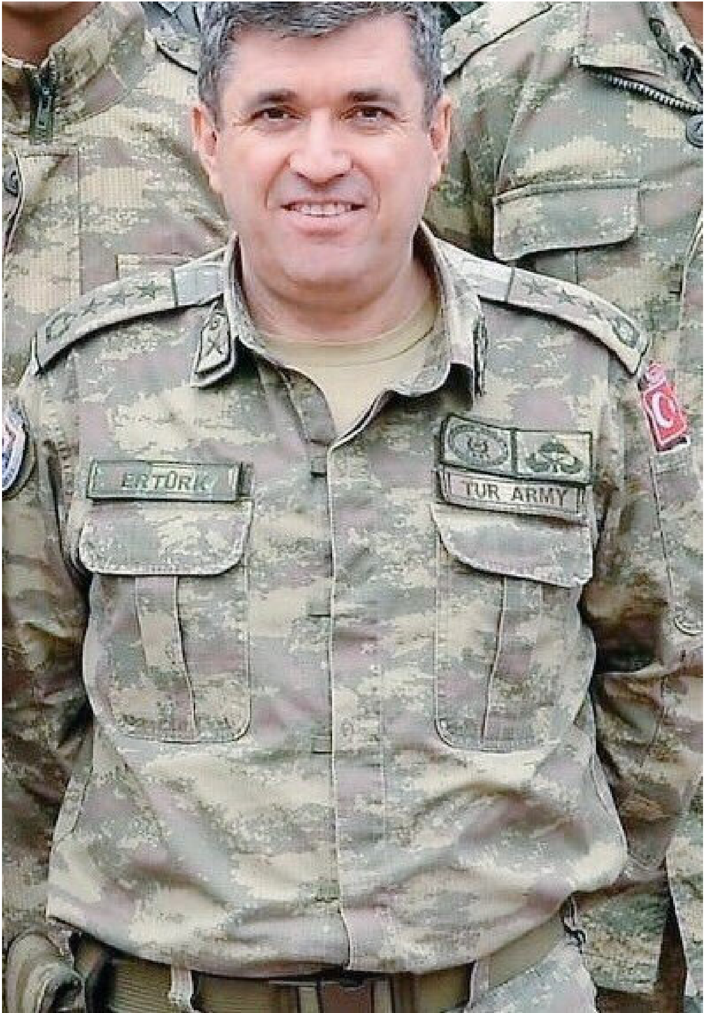
İstanbul'da darbe girişiminin engellenmesinde kilit rol oynadı: Sait Ertürk kimdir?