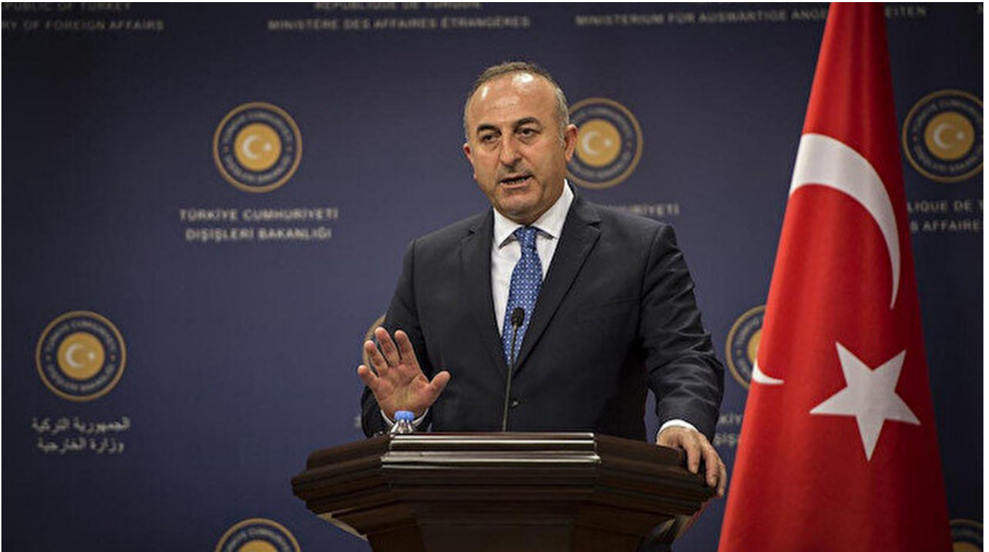
Dışişleri Bakanı Mevlüt Çavuşoğlu