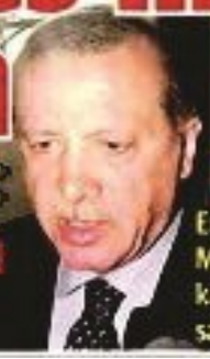
Erdoğan'ın Marmaris'te kaldığı otele saldırı

Erdoğan: Milletti meydanlarda karşılamaya toplandı. 100 binlik grubu, tanklarıyla, toplarıyla gelmeleri ve sokaklara ha-