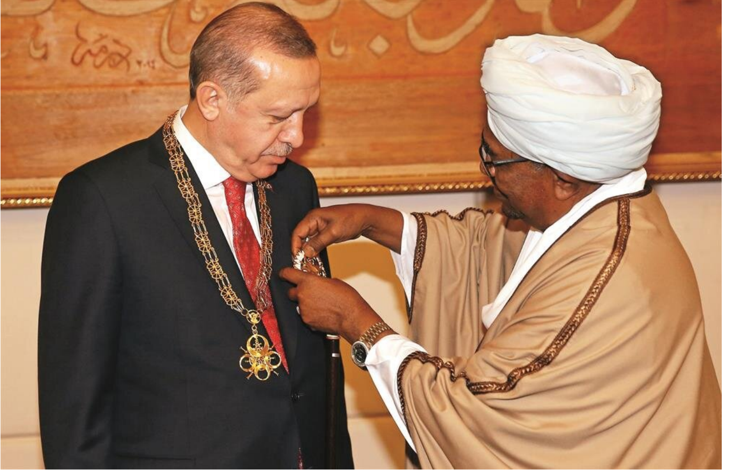
Sudan Cumhurbaşkanı El Beşir, resmi törenle karşıladığı Erdoğan'a Devlet Nişanı takdim etti.

Erdoğan, mevkidaşı Ömer el Beşir ile ortak açıklamasında, “128 ülkenin verdiği destek ve ABD'nin g'da kalması düşünüldüğünde ortaya bir gerçek çıkıyor: Ne kadar güçlü olursanız olun en güçlü olan haktır. Hak burada da galip gelmiştir. Biz gerek Filistinli kardeşlerimizin yanında olmak suretiyle gerekse yanlışların karşısında durmak suretiyle BM'nin bu işin takibini yakın planda ele almasını isteyeceğiz. Sayın Papa'nın Kudüs'le ilgili tavrını takdirle karşıladım. Bu süreci onların da takip edecek olması bir dayanışmayı ortaya koymuştur. İşgal altında kalan Kudüs'ün Türkiye'nin büyükelçiliğinin Kudüs'te olduğunu ifade etmek istiyorum. İşgal kalktığı zaman gereği yapılacaktır.”