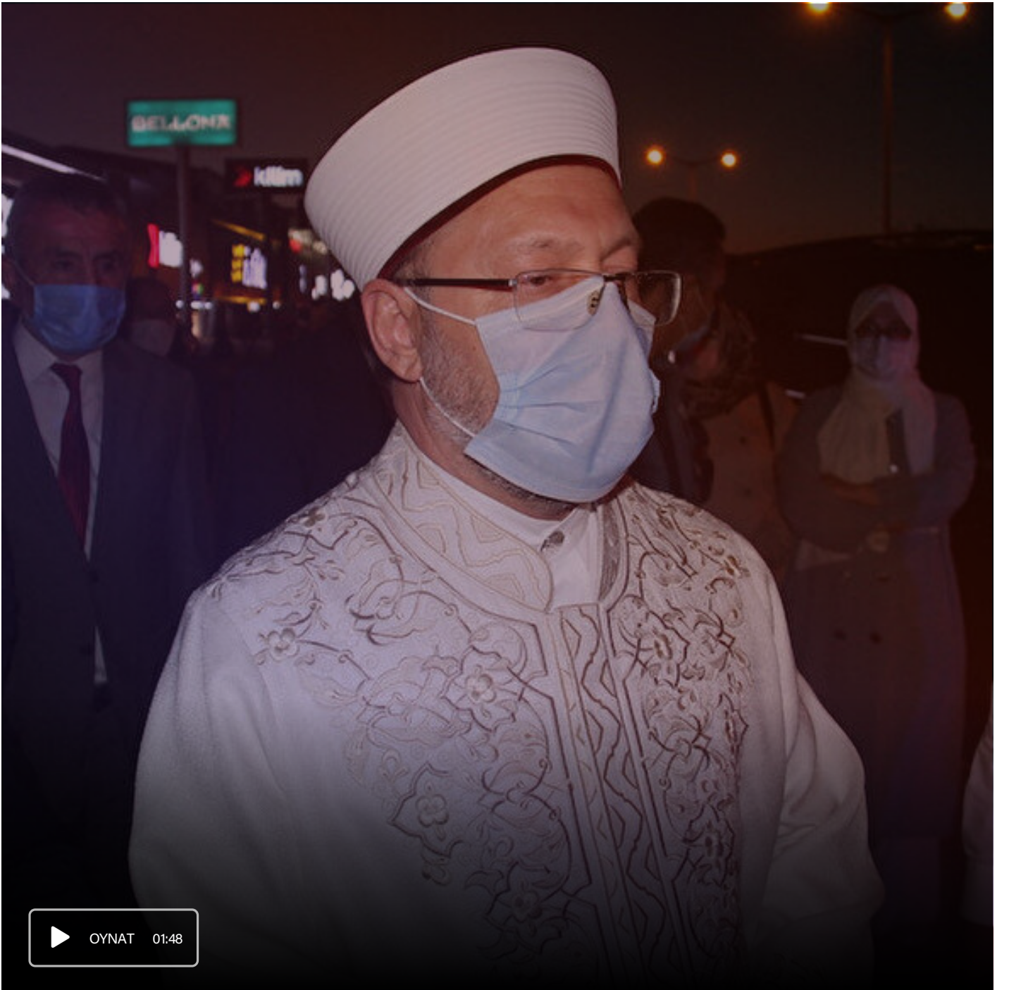
Diyanet İşleri Başkanı Ali Erbaş, Ayasofya camii hüviyetine kavuşmuş olmaktadır

Erdoğan, “Türk demokrasi tarihi bakımından nasıl bir önemi var 15 Temmuz direnişinin” şeklinde yöneltilen bir diğer soruya, “Türkiye’nin 1950’de başlayan demokrasi yolculuğu, maalesef her 10 yılda bir tekrarlanan müdahalelerle sürekli kesintiye uğradı. Sandıktan çıkan irade hiçbir zaman tam olarak ülke yönetimine yansımada. 1961 Anayasasıyla tesis edilen vesayet kurumları, millettan almadıkları yetkileri kullanarak, milletin iradesine ortak oldu. Gerek İstanbul Büyükşehir Belediye Başkanlığımız döneminde gerekse Başbakanlığımızda bunları hep karşımızda bulduk. Ne yaptıysak bunlara rağmen yaptık. Kefenimizi giyerek çıktığımız bu yolculukta, milletin emanetine sahip çıkma noktasında her türlü mücadeleyi verdik. Bu tarihi süreç içinde 15 Temmuz bir dönüm noktasıdır. 15 Temmuz, Türkiye’de gerçek anlamda millet egemenliğinin tesis edildiği gündür. Milletin iradesini teslim alma teşebbüsü, bizzat milletin direnişi ile engellenmiştir” dedi.