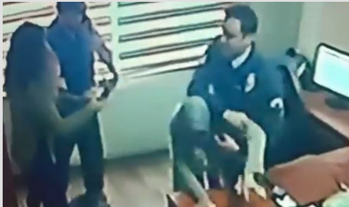
Yardım istedi, darbedilerek dışarıya atıldı