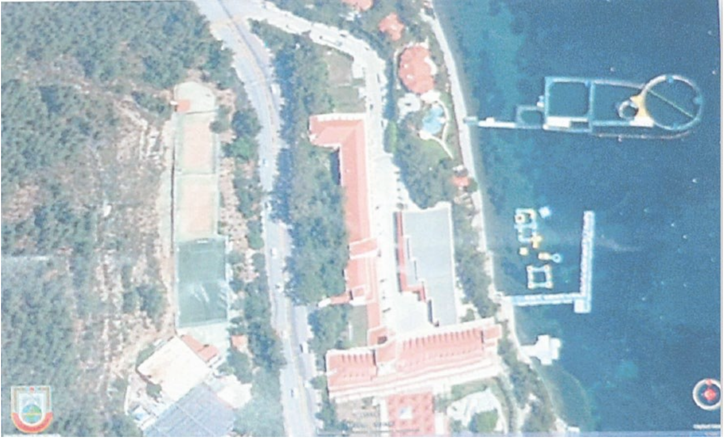
Erdoğan'ın kaldığı villanın değişme ihtimali de değerlendirilmiş.