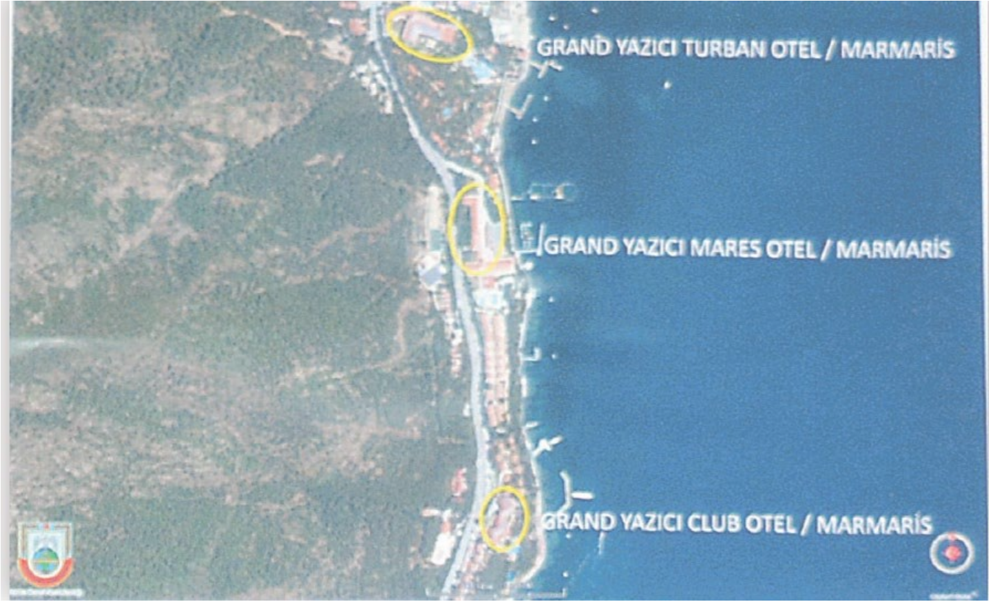
Grand Yazıcı Turban Otel dışında diğer oteller de tespit edilmiş.