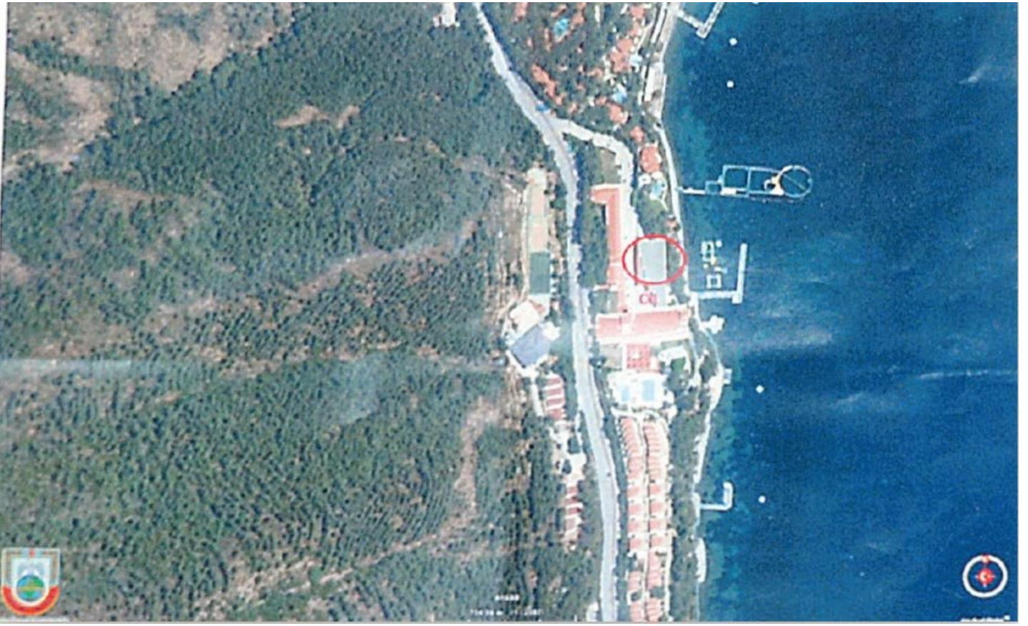
FETÖ'cü darbeciler, otellerin yerlerini daire içine de almış.