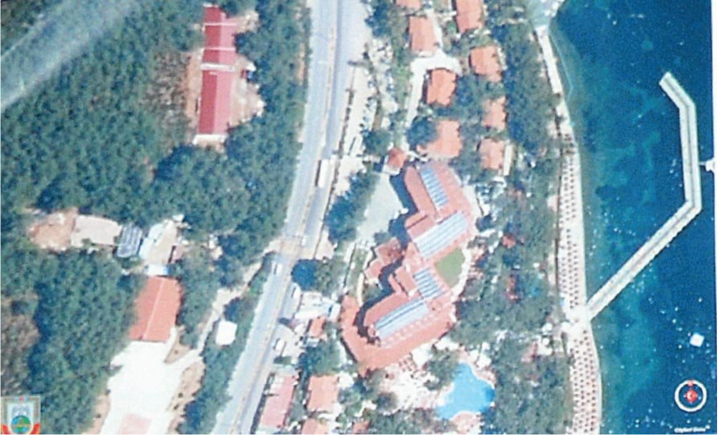
Erdoğan'ın kaldığı otelinin bulunduğu şerit böyle fotoğraflanmış.