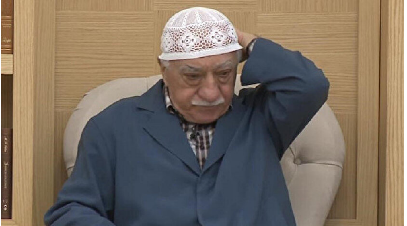
FETÖ elebaşı Gülen

Haber Merkezi · 22 Ocak 2019, 19:47 · Son Güncelleme: 22 Ocak 2019, 19:58 · AA