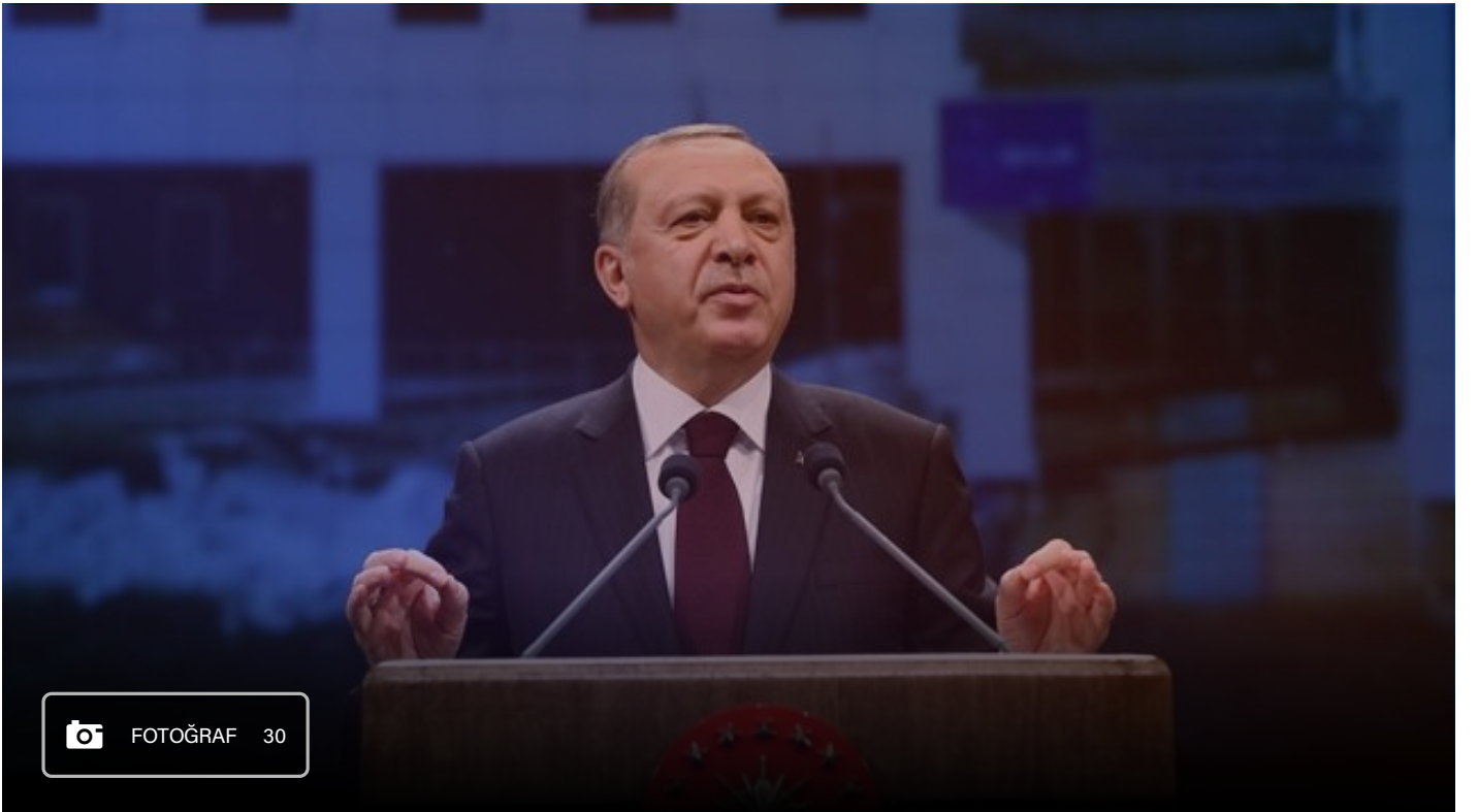
Erdoğan Bestene'de tonlu acılıs töreninde konuştu

Geçtiğimiz 14 yılda Sosyal Güvenlik konusunda çok geliştik. Devletin sosyal güvenlik kurumlarına katkısı ülkemizde de var. Ama artık mali açıdan şeffaf bir sosyal güvenlik sistemine de sahibiz. Bu sayede kurumlarımız yatırım yapıyor. Hizmetin kalitesini artırmanın yollarını arayabiliyoruz. Vatandaş devletine ulaştırmak için dere tepe koşturmuyor. Devlet hizmeti götürüyor. Vatandaşlarımız işyerinden, evinden işlerini takip edebiliyor. Buralara kolay gelmedik. Bu çağı yakalamanın bir mücadelesidir. Aylar süren işlemler bugün saatlere sığdırılmış durumda. Kafanızdaki soruları Alo 170 hattını arayarak çözebiliyorsunuz. Sosyal güvenlik en yoğun kullanılan alanların başında geliyor. Emekli maaşlarında da tarihi artışlara imza attık. Asgari ücret 2002'de 184 liraydı bugün bin 404 lira.