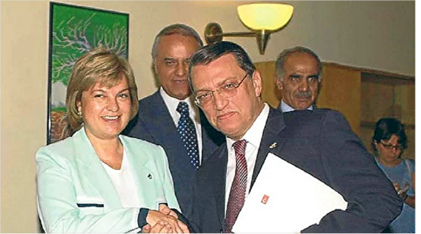
Üst aklın vazgeçemediği oyuncak: Koalisyonlar