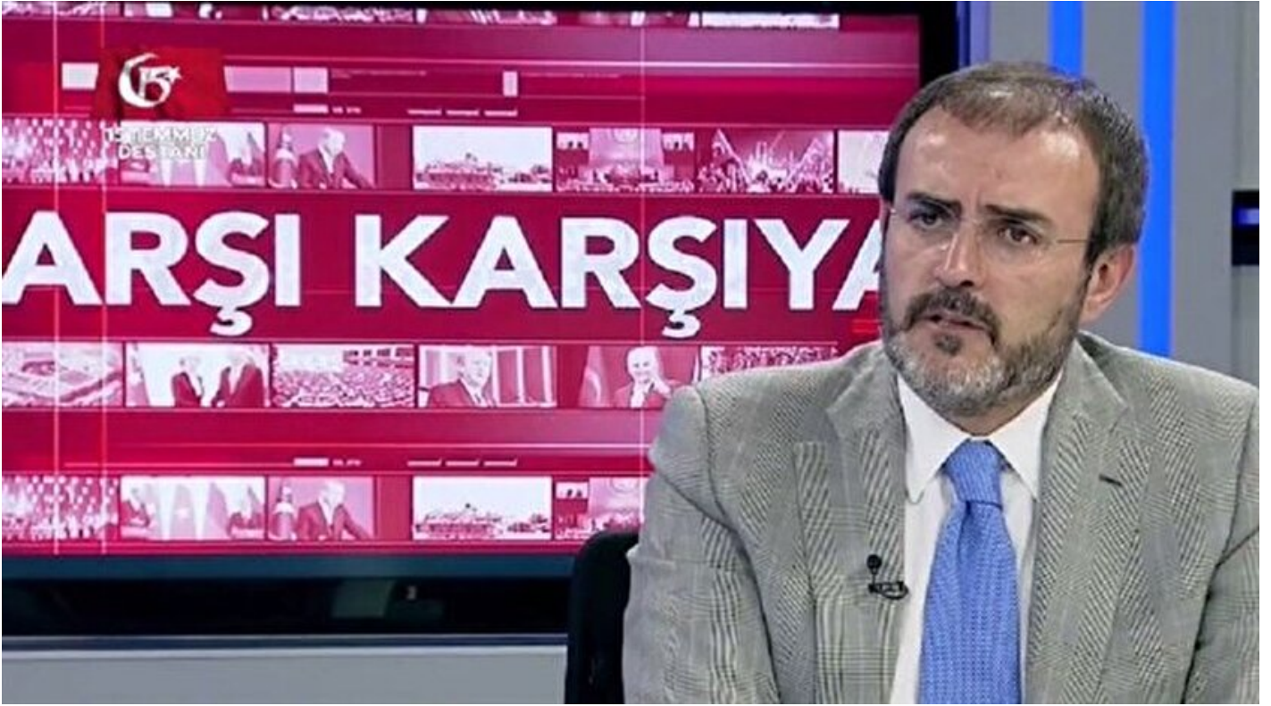
AK Parti Genel Başkan Yardımcısı ve Parti Sözcüsü Mahir Ünal