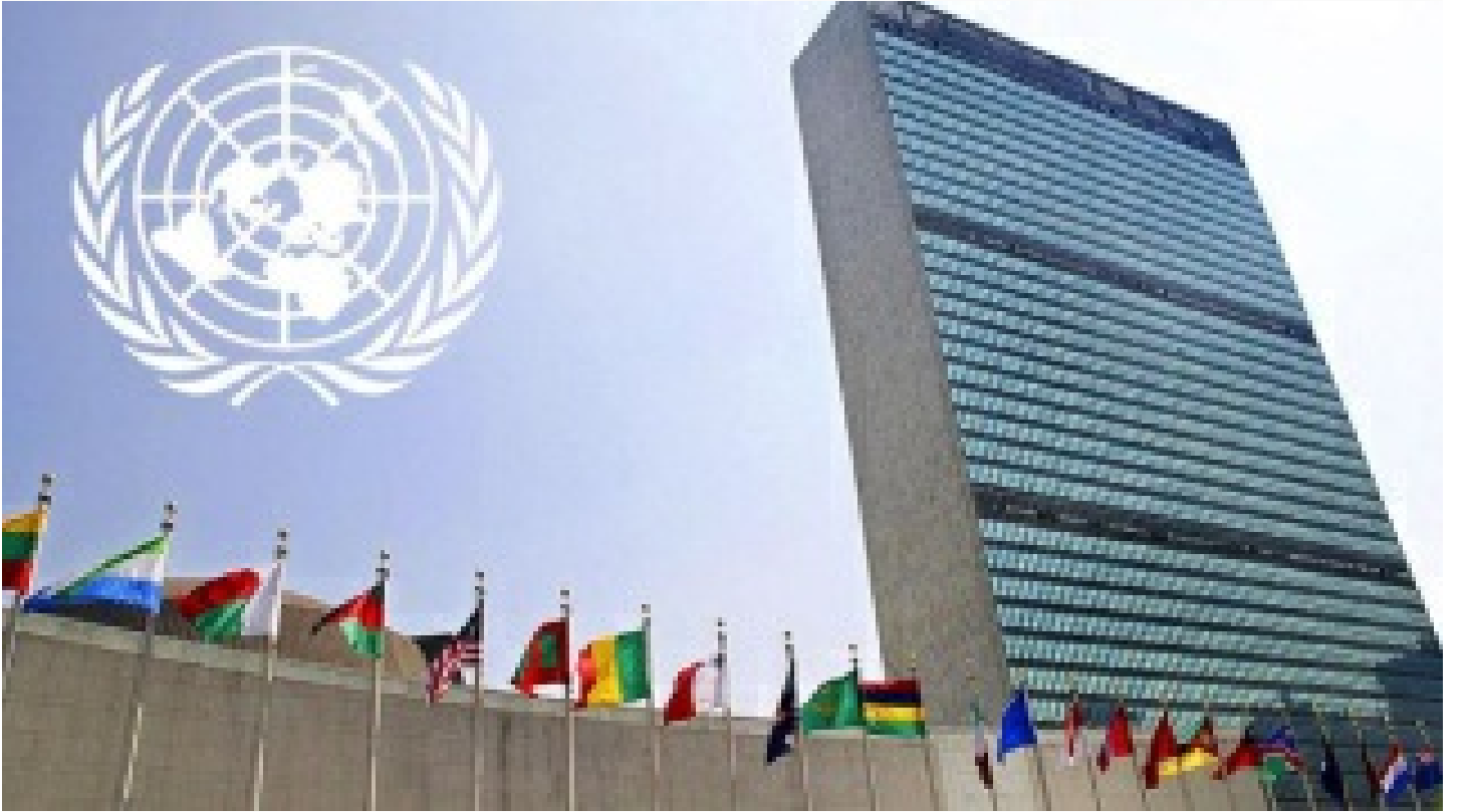
BM'den 'nükleer felaket yaşanmaması' çağrısı