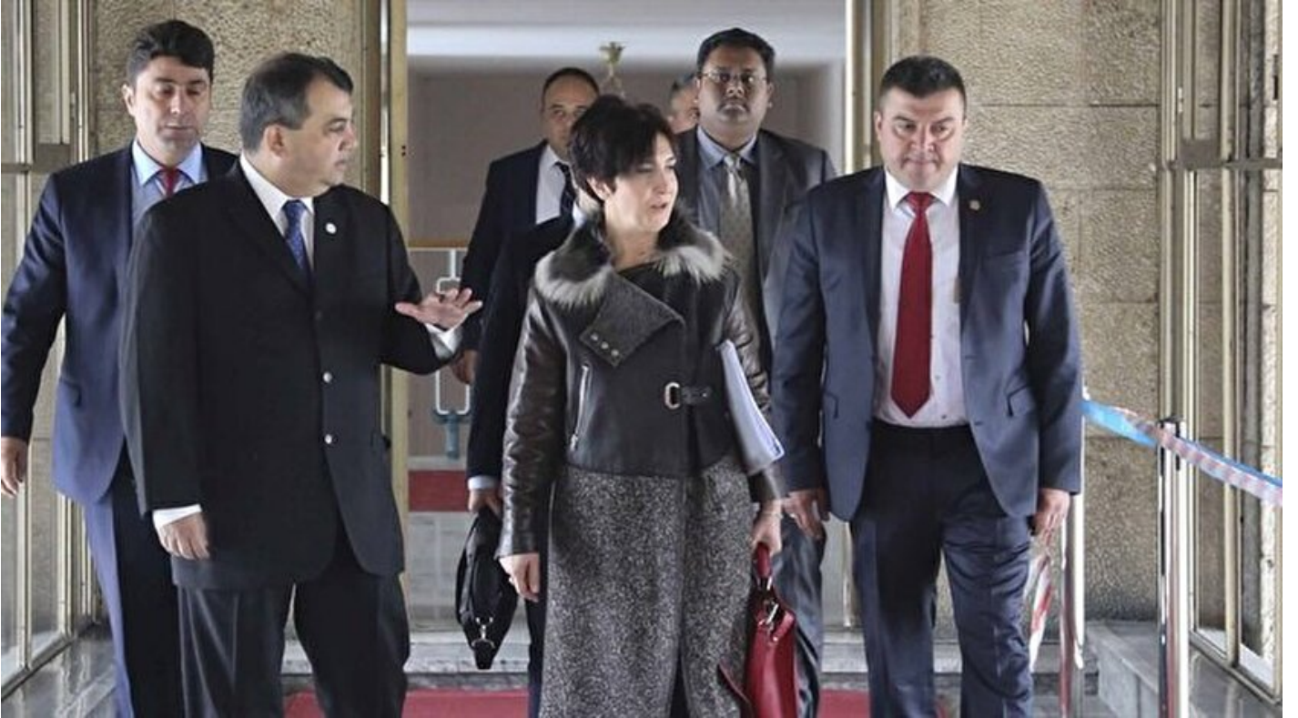
Parlamentolar Arası Birlik (PAB) Başkanı Saber Chowdhury. (Solda)

Haber Merkezi · 24 Ekim 2016, 17:16 · Son Güncelleme: 24 Ekim 2016, 17:20 · AA