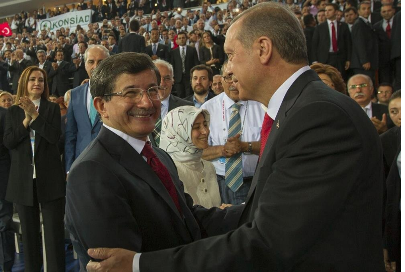
Başbakan Recep Tayyip Erdoğan'ın Cumhurbaşkanı seçilmesinin ardından gerçekleşen AK Parti 1. Olağanüstü Büyük Kongresinden bir kare.

AK Parti'nin kurucu ve doğal lideri olan Recep Tayyip Erdoğan'ın Cumhurbaşkanı seçildikten sonra AK Parti'nin genel başkanlığına Ahmet Davutoğlu'nun geçmesi ile birlikte iktidar karşıtı kesimler 'AK Parti Erdoğan olmadan başarılı olamaz' tezi üzerinden 7 Haziran'a dönük ortak bir cephe kurmaya çalıştı.