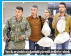
Van'da seçim için olağanüstü güvenlik tedbirleri alındı.

■ Seçim öncesi Van'da kanlı muslukla vatandaşları ölümle tehdit eden HDP, aynı ilde AK Partili müsahitlerin sandığa gitmesini engelledi. Telefonla örgüt tarafından tehdit edilen 600 müsahit istifa etti. Kırsalda HDP'li acık oy kullandı. AK Partili iki kadın görevli ise linc edilme istendi.