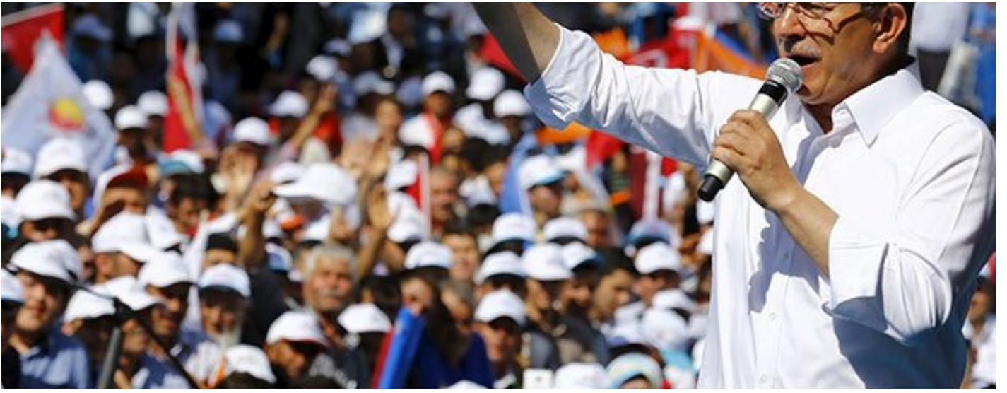
AK Parti, yeni bir anayasa, yeni bir sistem, asgari ücretin artırılması, emeklilere ek ücret gibi vaatlerde bulundu.