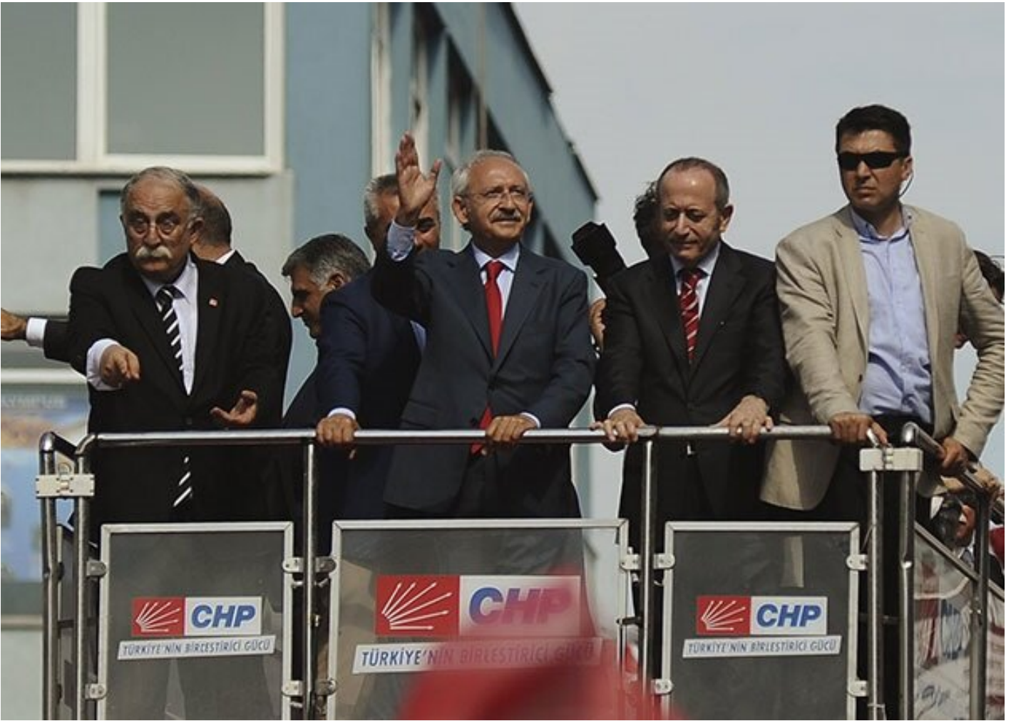
CHP seçim beyannamesini 'Yaşanacak bir Türkiye' sloganı ile yayınladı.