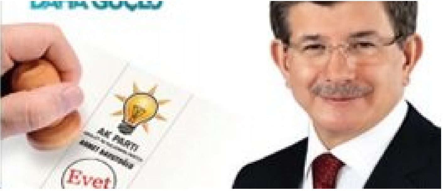
7 Haziran AK Parti seçim afişi.

Bu saldırılara rağmen AK Parti'nin 30 Mart yerel seçimlerinde oyların yüzde 45,60'nı alarak büyük bir zafer elde etti. İktidar karşıtı kesimler yeni stratejilerini Cumhurbaşkanlığı seçimlerinin üzerine inşa ettiler.