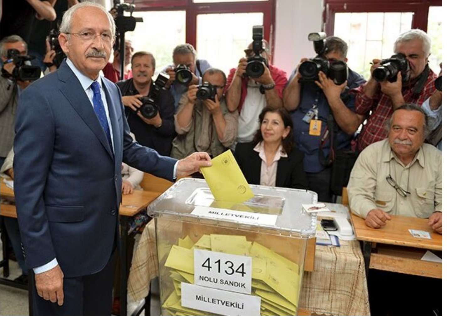
Kemal Kılıçdaroğlu oy kullanırken.

7 Haziran'da gerçekleşen seçimlerde AK Parti ilk defa oy kaybetti ve milletvekili sayısında düşüş yaşadı. AK Parti yüzde 40,98 oy oranı ile birinci parti çıkıp 258 milletvekili çıkarmasına rağmen iktidar olamadı. Bunun en önemli nedeni olarak, AK Parti'nin söyleminin yeterli etkiyi doğuramaması, lider değişimi, FETÖ ve diğer kesimlerin gerçekleştirdiği kara propaganda ve muhalefetin yeni söyleminin etkili olmasıydı.