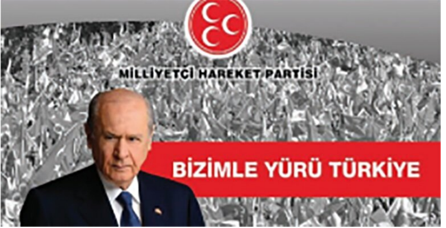
MHP seçim afişi.

7 Haziran seçim vaatleri ekonomi odaklıydı. CHP, MHP ve HDP seçimleri kazanmaları halinde başta asgari ücret olmak üzere birçok alanda reform yapacaklarını savundu. CHP 'Yaşanacak bir Türkiye' sloganı ile yayınladığı seçim beyannamesinde, darbe yasalarını kaldırma, emeklilerin maaşlarında artış, asgari ücretin bin 500 liraya çıkarılması gibi vaatlerde bulundu.