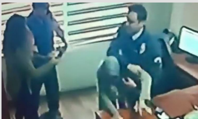
Yardım istedi, darbedilerek dışarıya atıldı