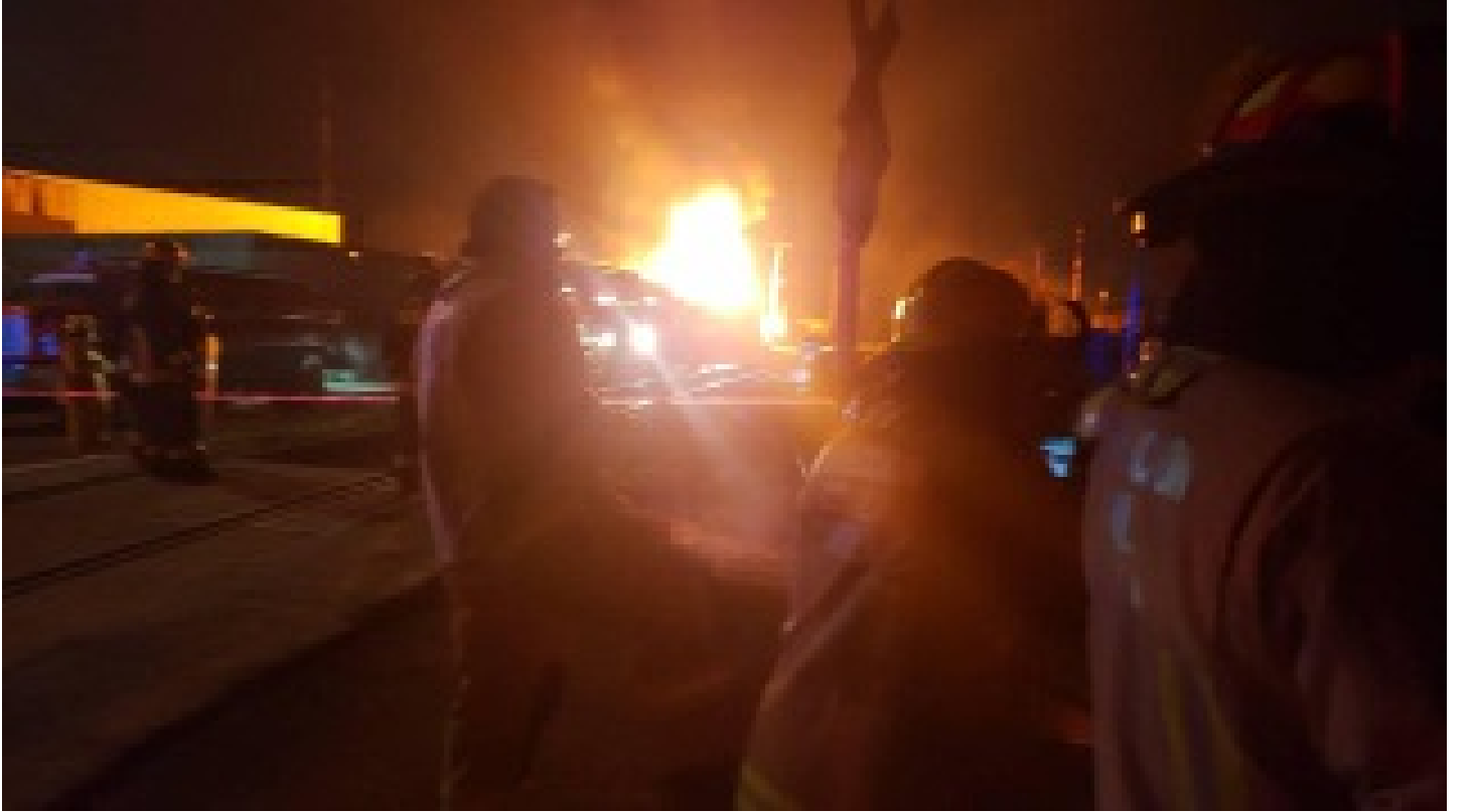
Dolmabahçe Sarayı'nda yangın!