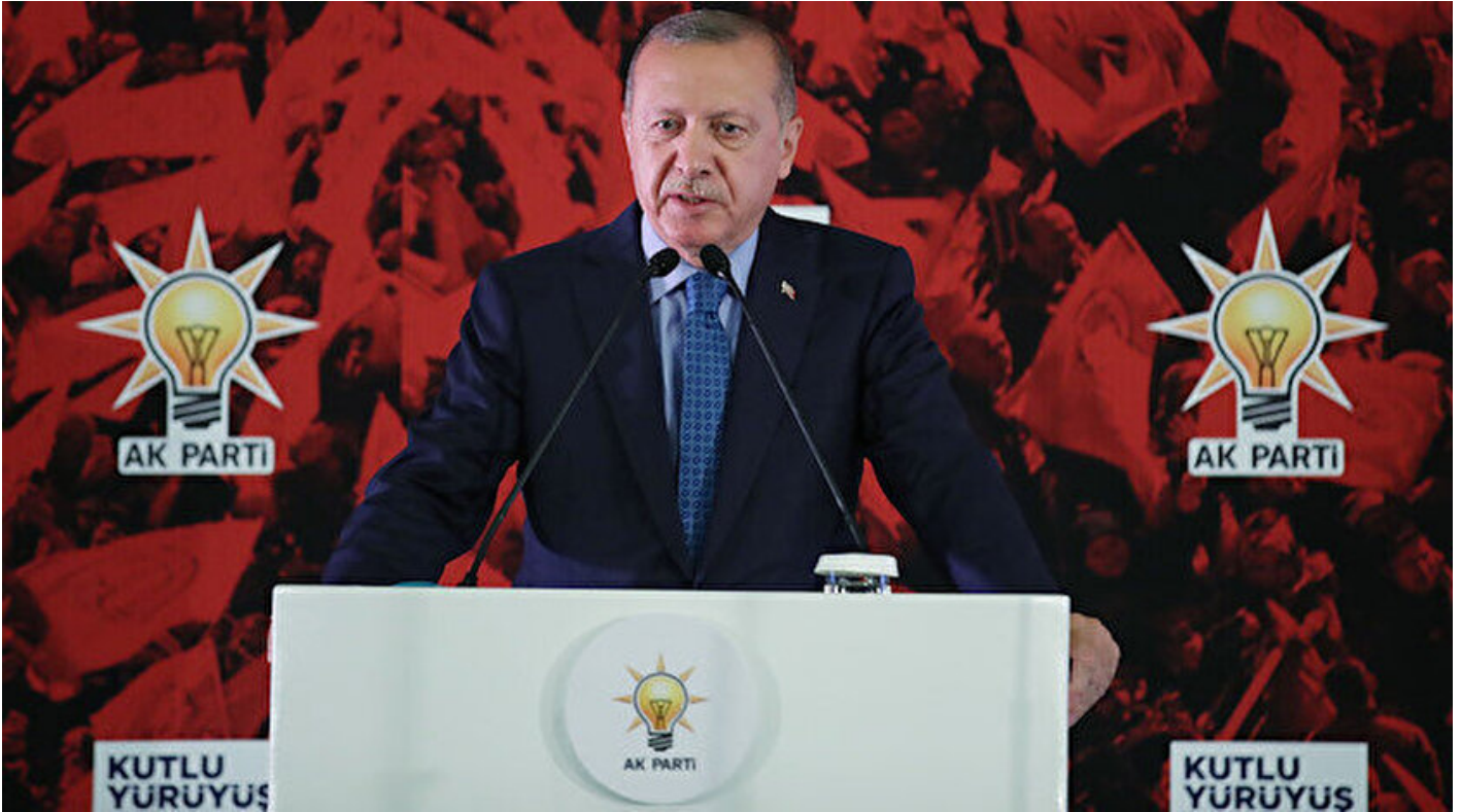
Cumhurbaşkanı Recep Tayyip Erdoğan