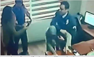
Yardım istedi, darbedilerek dışarıya atıldı