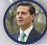
MEKSİKA CUMHURBAŞKANI ENRIQUE PENA NIETO

Trump'ı, Alman Nazi lideri Adolf Hitler'e benzetmişti