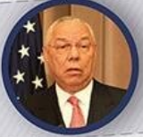
ESKİ DIŞİŞLERİ BAKANI COLIN POWELL

"Ülke için utanç kaynağı ve ulusal bir felaket"