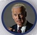
ABD BAŞKAN YARDIMCISI JOE BIDEN

"Dış politikada cahil ve ABD'nin dış politikasına ciddi tehdit. Bu adama nükleer silahların şifrelerinin verildiğini düşünsenize"