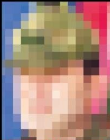
■ 48. Hudut Tugay Komutanı Tuğgeneral Rıdvan Yücel Yıldız