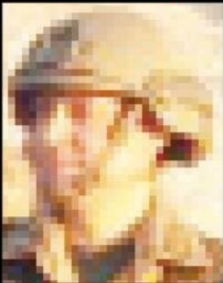
■ 4. Komando Tugay Komutanı Tuğgeneral Ömer Faruk Cantenar