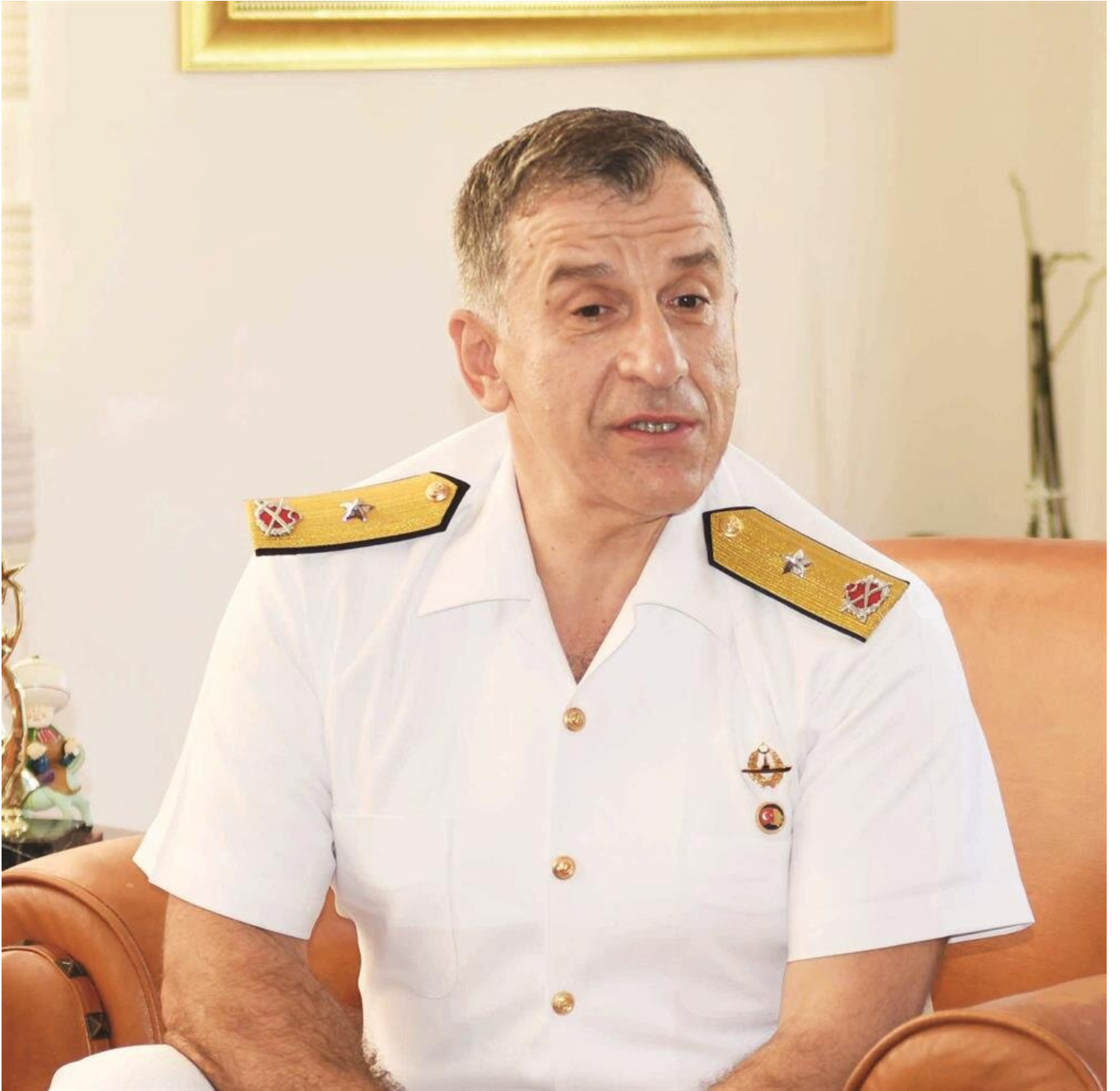
Tuđamiral Ali eki

Milli Savunma Bakanlıđı'na dün yapılan açıklamada, atama alıřmaları öncesi, 7 general ve amiralin kendi istekleriyle emeklilik talebinde buldukları ve yapılan deđerlendirme sonucu bařvuruların 18 Ađustos 2017 tarihinde onaylandıđı açıkladı. 7 general/amiral için herhangi bir atama yapılmaksızın emeklilik kararı verildi. Edinilen bilgiye göre, emekli edilen isimlerin çođunun yakın aile çevresi ve akrabalarında ByLock tespit edildi. Sözkonusu general ve amirallerin de bu řüphe üzerine emeklilik kararı aldıkları konuşuluyor. Emekli edilen generallerin biri 'tüm', 6'sı ise 'tuđ' seviyesinde. Tuđgeneral ve tuđamiral rütbesindeki 6 ismin tamamı da 15 Temmuz sonrası terfi etmişlerdi.