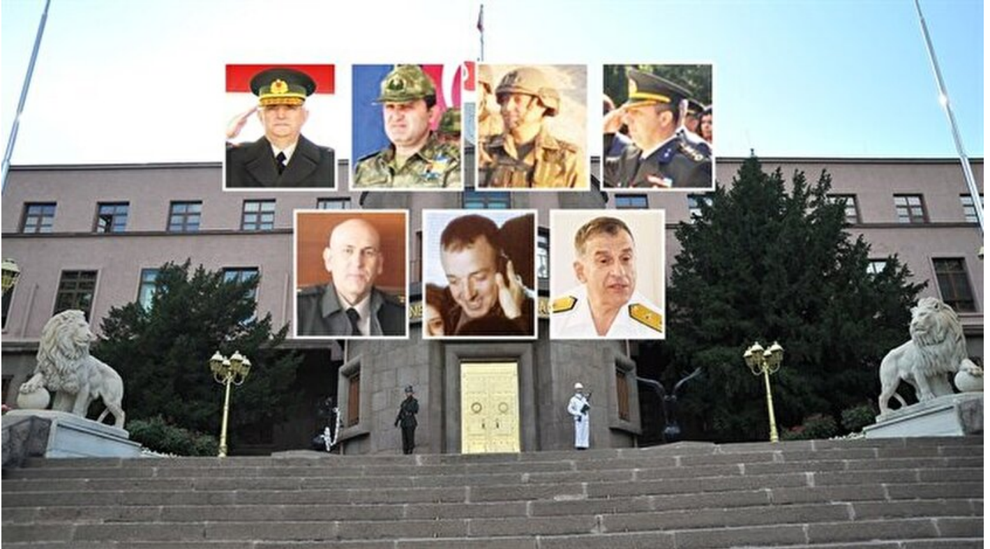
Generaller ByLock'tan emekli