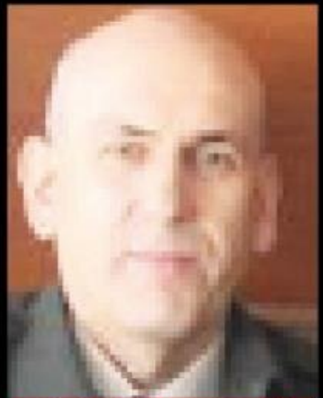
■ 3. Ordu Komutanlığı Yarbaşkanı Tuğgeneral Ömer Karaimamoğlu