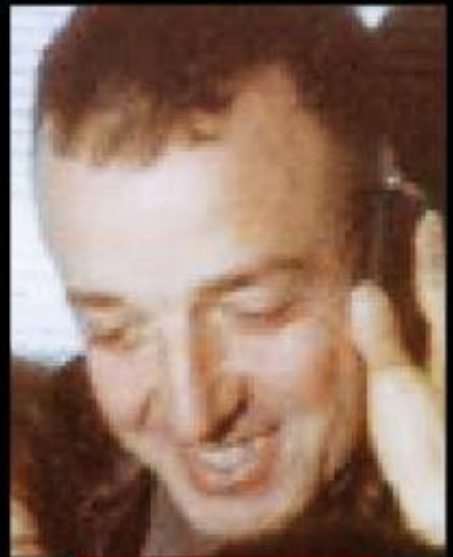
■ D.K.K. Teknik Başkanı Tuğamiral Necmi Yıldırım