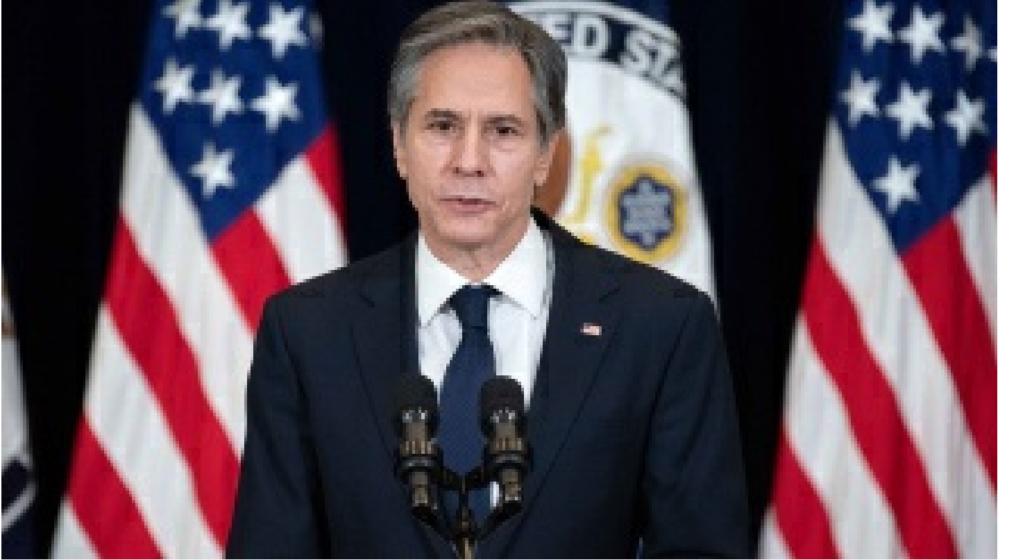
Blinken: Çatışma istemiyoruz ama buna hazırız