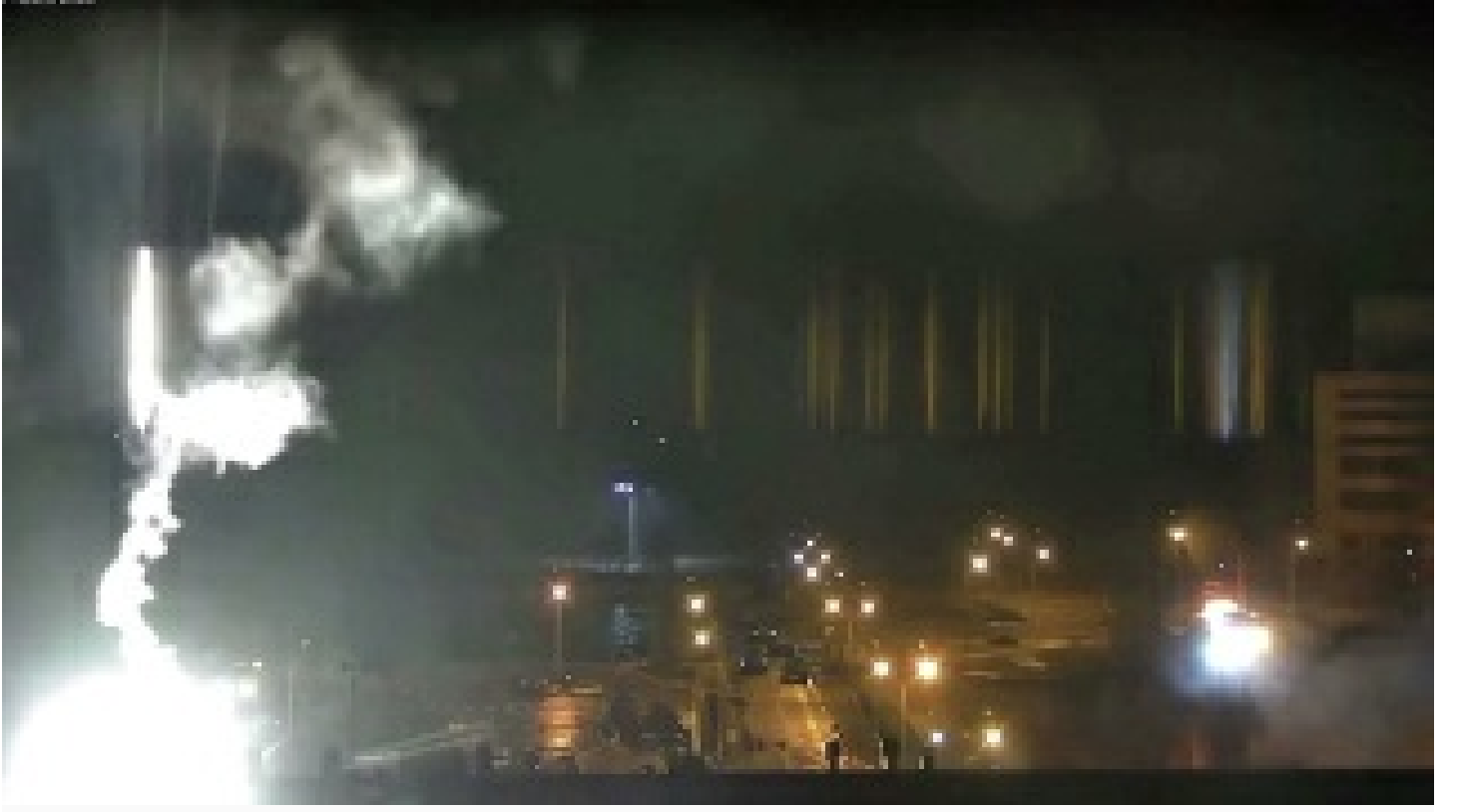
Ukrayna ateşle oynuyor! Nükleer Santrali Ukrayna kundaklamış!