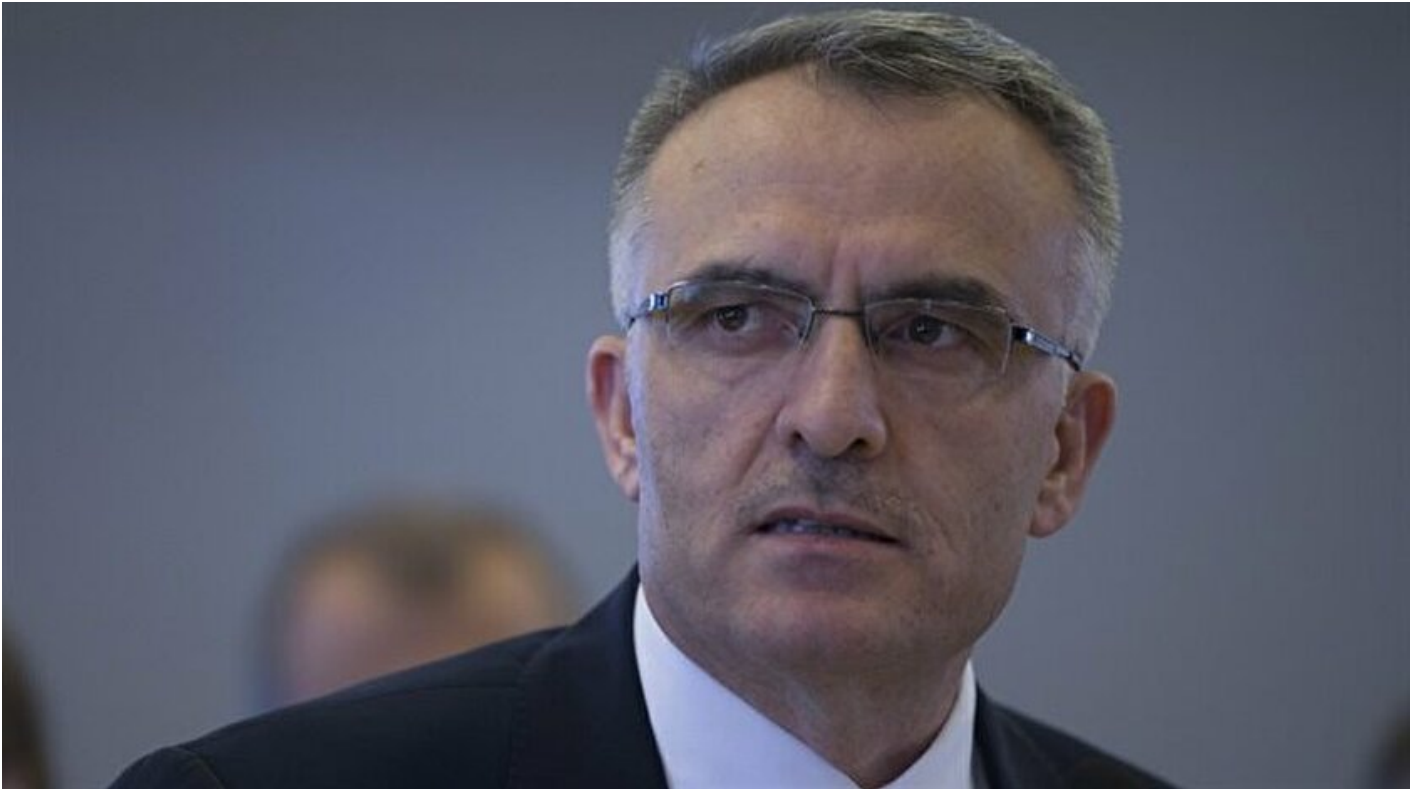
Maliye Bakanı Naci Ağbal

Haber Merkezi · 30 Ekim 2016, 09:52 · Son Güncelleme: 30 Ekim 2016, 15:25 · AA