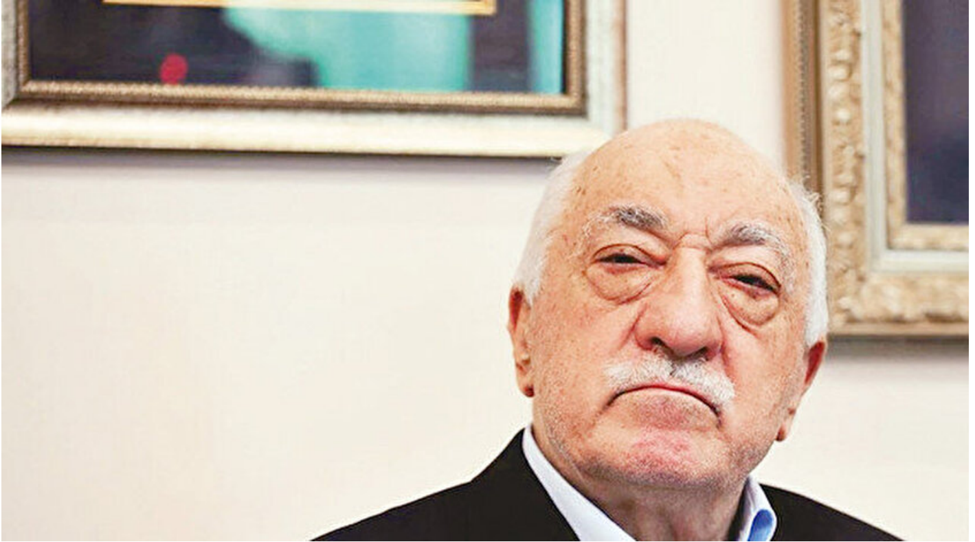
FETÖ teröristbaşı Fetullah Gülen