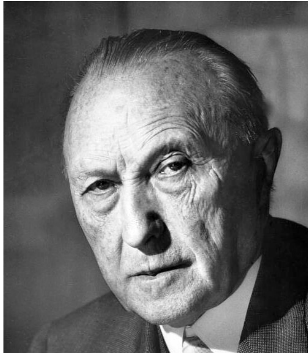
CIA'nın Konrad'ı çok etkili Konrad Adenauer

Türkiye'de kaos ve karmaşa yaratmayı amaçlayan birçok olayın perde arkasında rol oynayan vakıflar, Gezi olaylarının yanısıra PKK'nın hendek kazıp barikat kurma eylemlerinde, hatta Artvin-Cerattepe olaylarında da başrolde bulundu. Yerel yönetimlere altyapı çalışmaları için kredi sağlayan 'Kauf-W' adlı 'yardım' kurumu, HDP'ye bağlı belediyelere iş makineleri alımında aracılık etti. Bu makineler daha sonra PKK'nın mayın döşeme 'iş'lerinde kullanıldı. PKK'nın çukur ve hendeklerinde parmağı olduğu ortaya çıkan ve gözaltına alınan 5 Alman uyruklu ajan, operasyonlar sırasında tutuklanmıştı.