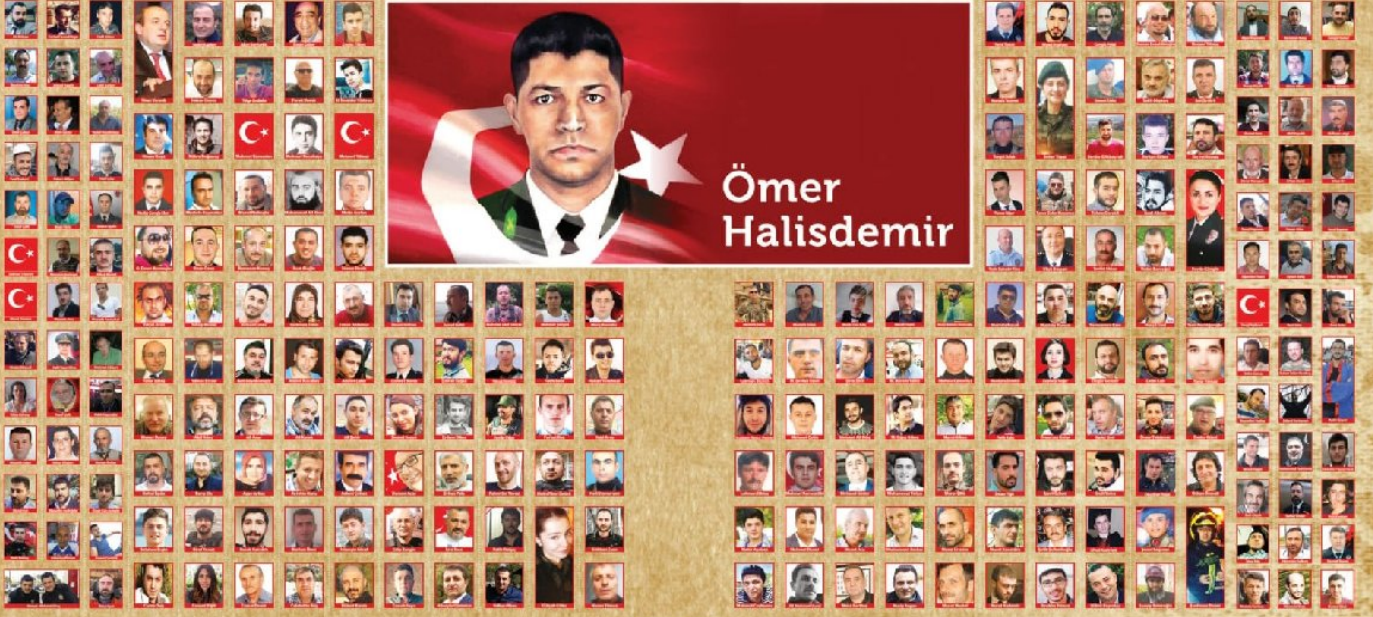
FOTO: 15 Temmuz Darbe Girişiminin Arkasındaki FETÖ, Yargıtay Cumhuriyet Başsavcılığı

Saat 16.16: Kara Havacılık Komutanlığı'nda görevli bir subay MİT'e giderek, FETÖ üyesi askerler tarafından MİT Müsteşarı Hakan Fidan'ın alınması için kuruma saldırı olacağını ihbar etti. Fidan, Genelkurmay 2. Başkanı Orgeneral Yaşar Güler'i telefonla aradı, konu hakkında bilgi verdi.