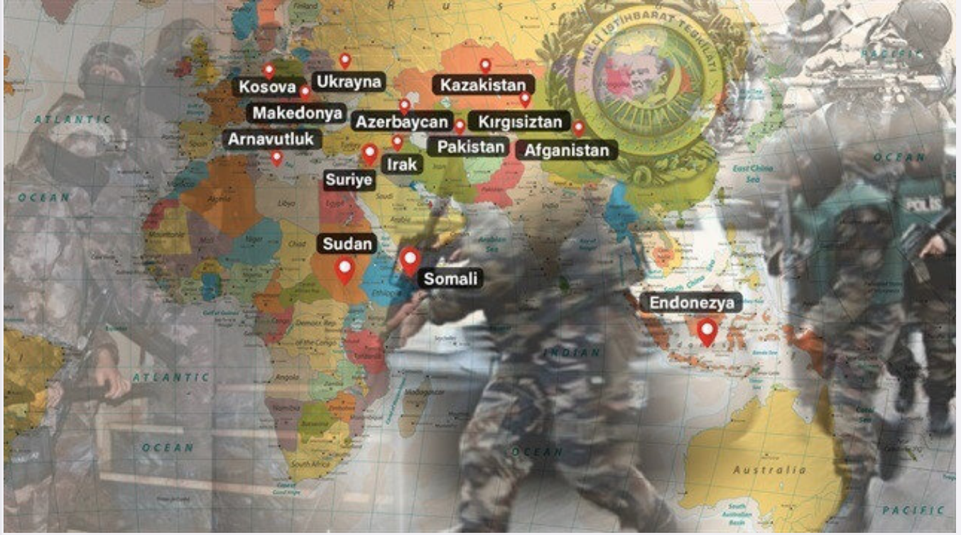
Milli İstihbarat Teşkilatı Başkanlığı, FETÖ/PDY mensupları başta olmak üzere, dünyanın çeşitli yerlerinde

FETÖ davaları gündeme geldiğinde, örgütün özellikle CIA, BND, Mossad ve MI6 gibi istihbarat kuruluşlarıyla dirsek temasında olduğu ve buralara Türkiye ile ilgili mahrem bilgi/belgeleri gönderdikleri kamuoyuyla paylaşılmıştı.