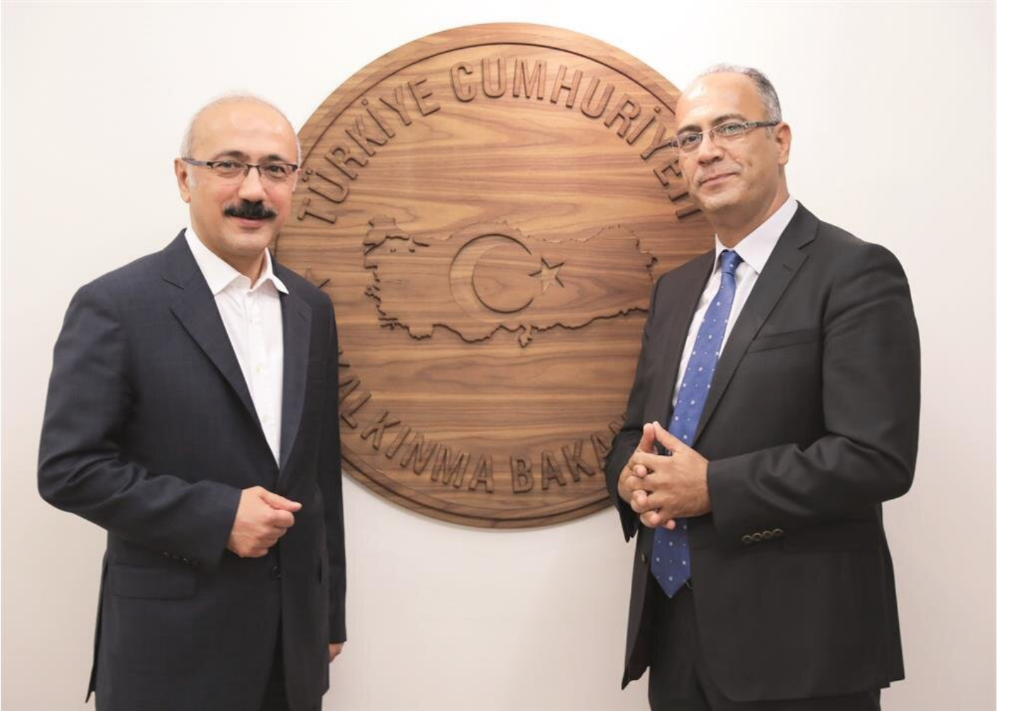
Lütfi Elvan - Cahit Saraçoğlu

2018'in Türkiye için fırsat dönemi olacağını belirten Elvan, yüksek büyüme performansının, yatırımcılar açısından bir fırsat olduğunu dile getirdi. Avrupa'da Almanya ile siyasi sıkıntılarının olduğuna dikkat çeken Elvan, "Bunun ekonomik alana yansımadığını görüyoruz. Yatırımcı için uygun bir ortam var" tespitini dile getirdi.