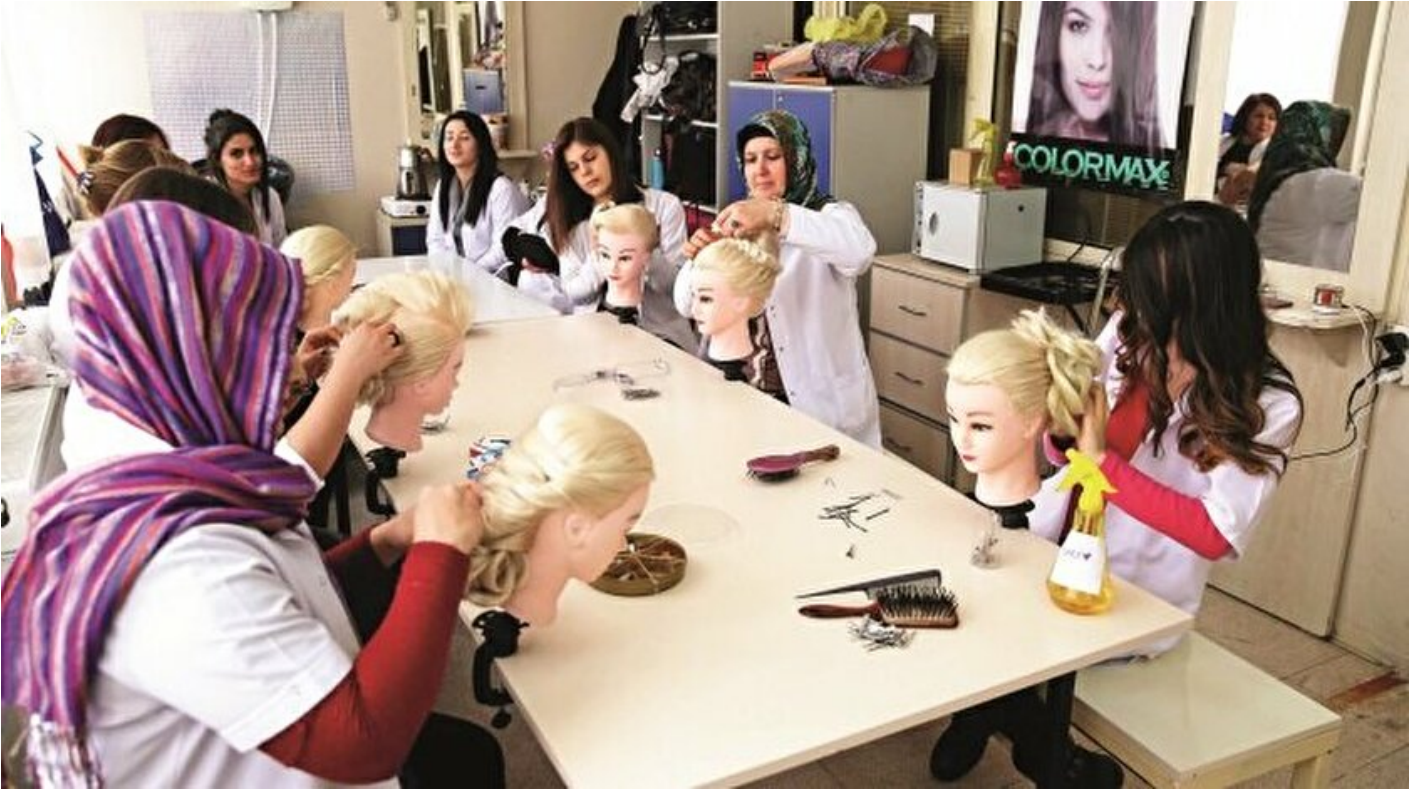
20 bin kadına altın bilezik

Cahit Saraçoğlu · 12 Eylül 2017, 04:00 · Yeni Şafak