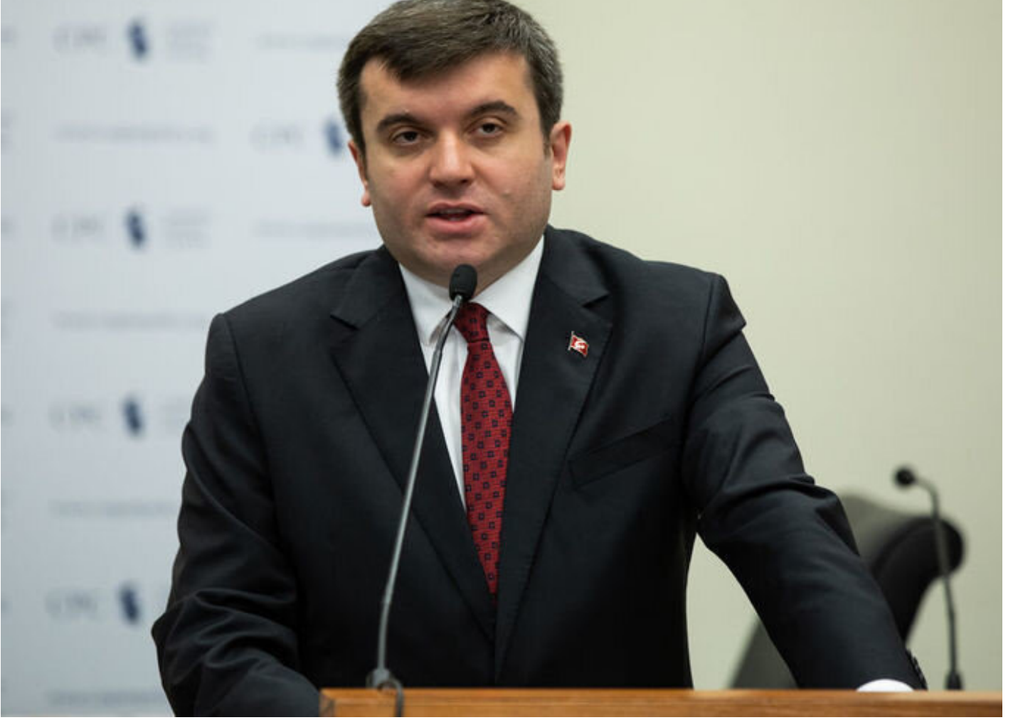
Dışışleri Bakan Yardımcısı Yavuz Selim Kıran

Amerikan Kongresinde Cumhurbaşkanlığı İletişim Başkanlığının organize ettiği kapsamlı etkinlikte Türk-Amerikan ilişkilerini derinlikli olarak ele aldıklarını kaydeden Kıran, “Türk-Amerikan ilişkilerinin geleceğine olan inancımızı anlattık.” dedi.