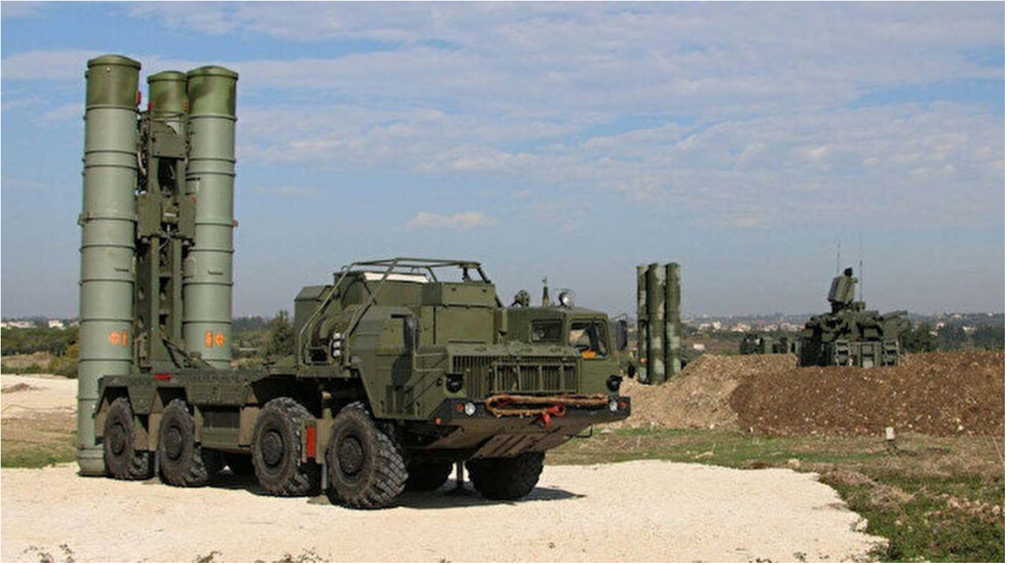
S-400 hava savunma füzesi

Haber Merkezi · 23 Mayıs 2019, 08:39 · Son Güncelleme: 23 Mayıs 2019, 08:45 · AA