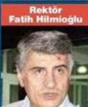
Rektör Fatih Hilmioglu

SUÇU: Cebir ve şiddet kullanarak hükümetin görevini yapmasını engellemeye ve darbeye teşebbüs... CEZASI: 13 yıl 11 ay