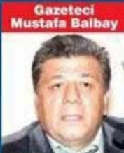
Gazeteci Mustafa Balbay

SUÇU: Cebir ve şiddet kullanarak hükümetin görevini yapmasını engellemeye ve darbeye teşebbüs... CEZASI: Müebbet