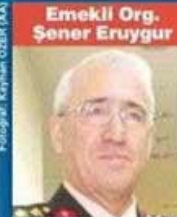
Emekli Org. Şener Eruygur