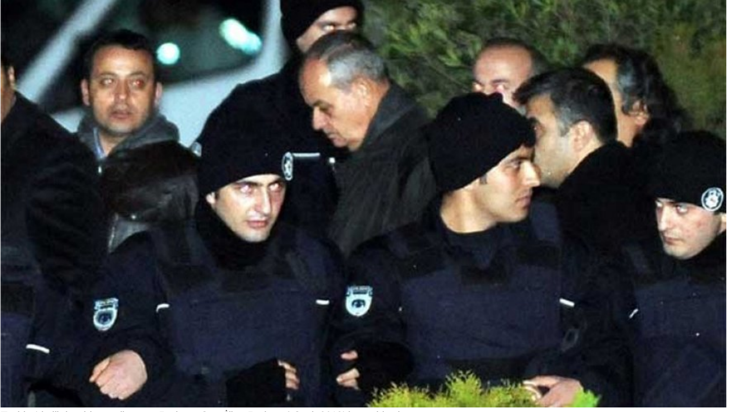
Türkiye'de ilk kez bir genelkurmay Başkanı, Org. İlker Başbuğ 6 Ocak 2012'de tutuklandı