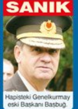
Hapisteki Genelkurmay eski Başkanı Başbuğ