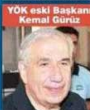
YÖK eski Başkanı Kemal Gürüz

SUÇU: Ergenekon Terör Örgütü'ne üye olmak ve hükümete karşı darbeye teşebbüs etmek... CEZASI: 34 yıl 8 ay