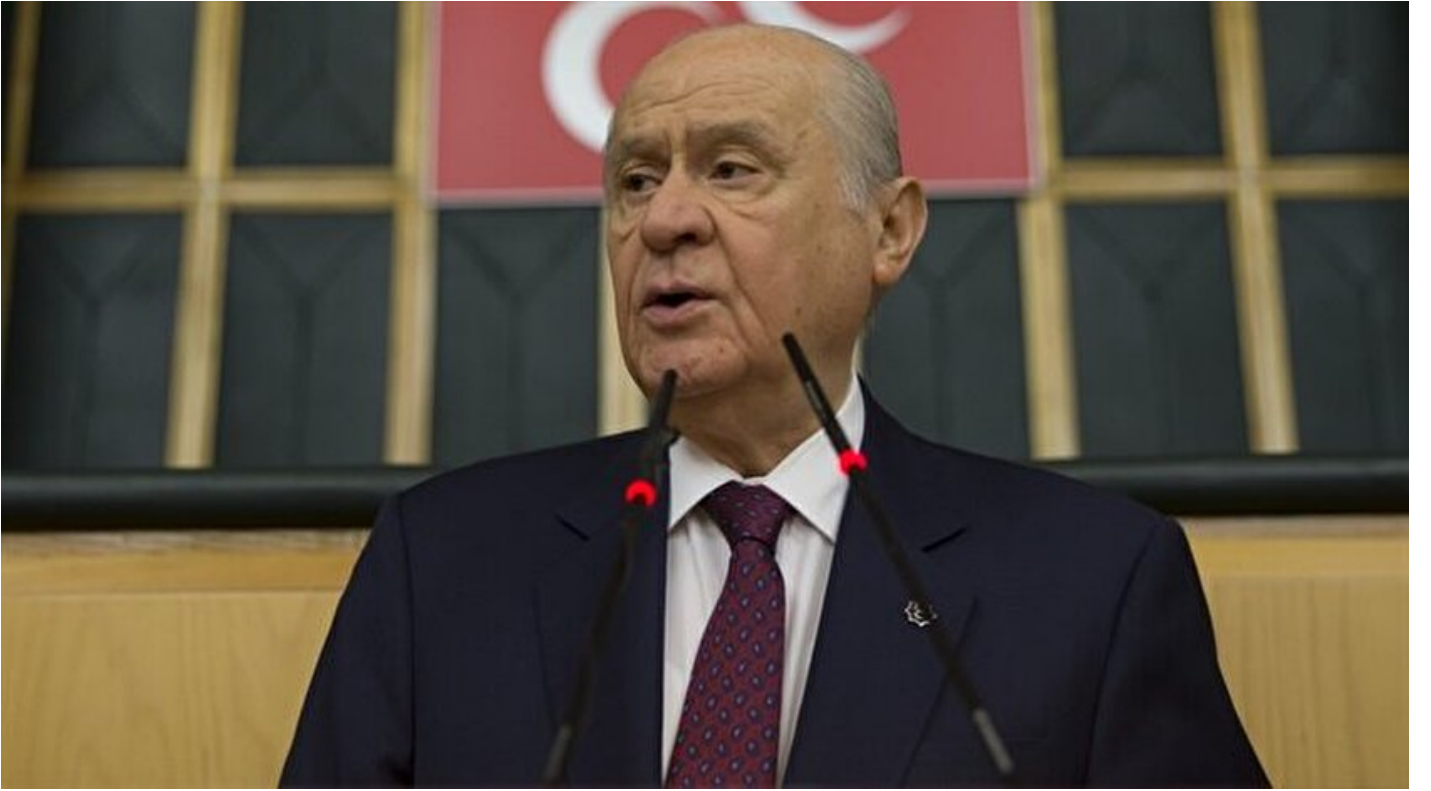
MHP Genel Başkanı Bahçeli