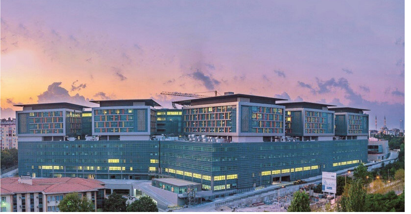
Okmeydanı şehir hastanesi

Mevcut hastaneleri güçlendirme yanında, yeni hastaneleri de süratle hizmete açtıklarını aktaran Erdoğan, “Gerçekten çok modern bir sağlık tesisi olan, Şehir Hastanelerimiz özellikle bu evsftaki standartlarda 600 yataklı Okmeydanı Hastanemiz bugün itibariyle hizmet vermeye başladı. Burayı daha önce eğitim araştırma hastanesi olarak planlamıştık fakat öyle bir evsafa sahip oldu ki biz burayı süratle şehir hastanesine dönüştürelim. Bugün şehir hastanesi olarak açılışı yapıldı.” dedi. Yine Şehir Hastanesi statüsündeki 1.150 yatak kapasiteli Kartal Hastanesi’ni de bir süre önce hizmete sunduklarını hatırlatan Erdoğan, İkitelli Şehir Hastanesi’ni ise, 520’si yoğun bakım olmak üzere 2 bin 682 yatak kapasitesiyle mayıs ayında hizmete açmayı planladıklarını aktardı.