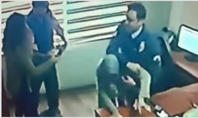
Yardım istedi, darbedilerek dışarıya atıldı