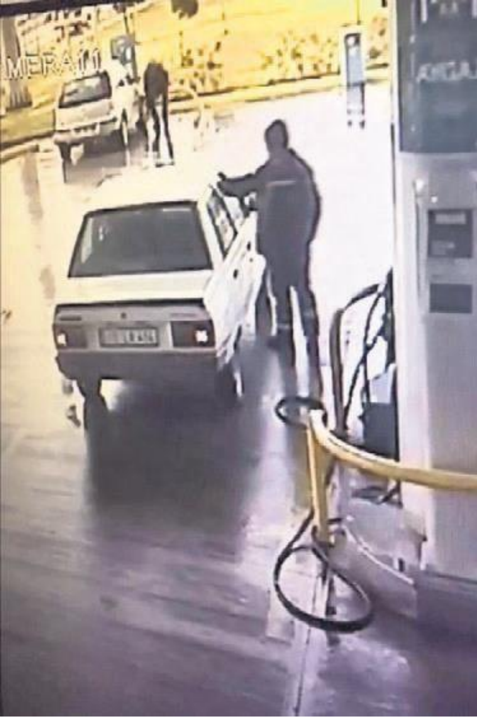
O araç saldırıdan önce bir benzin istasyonunda böyle görüntülenmişti.

FETÖ üyesi olduğu gerekçesiyle saldırıdan bir hafta sonra tutuklanan Arslantürk'ün uygulamayı yoğun kullanan üyelerin yer aldığı 'kırmızı' ByLock listesinde olduğu tespit edildi. Saldırı sonrası gözaltına alınan Arslantürk aracı internetten sattığını söylemişti. Ancak yapılan araştırmada Arslantürk'ün birçok kez A.K. ile telefonda görüşüp buluştuğu ortaya çıktı