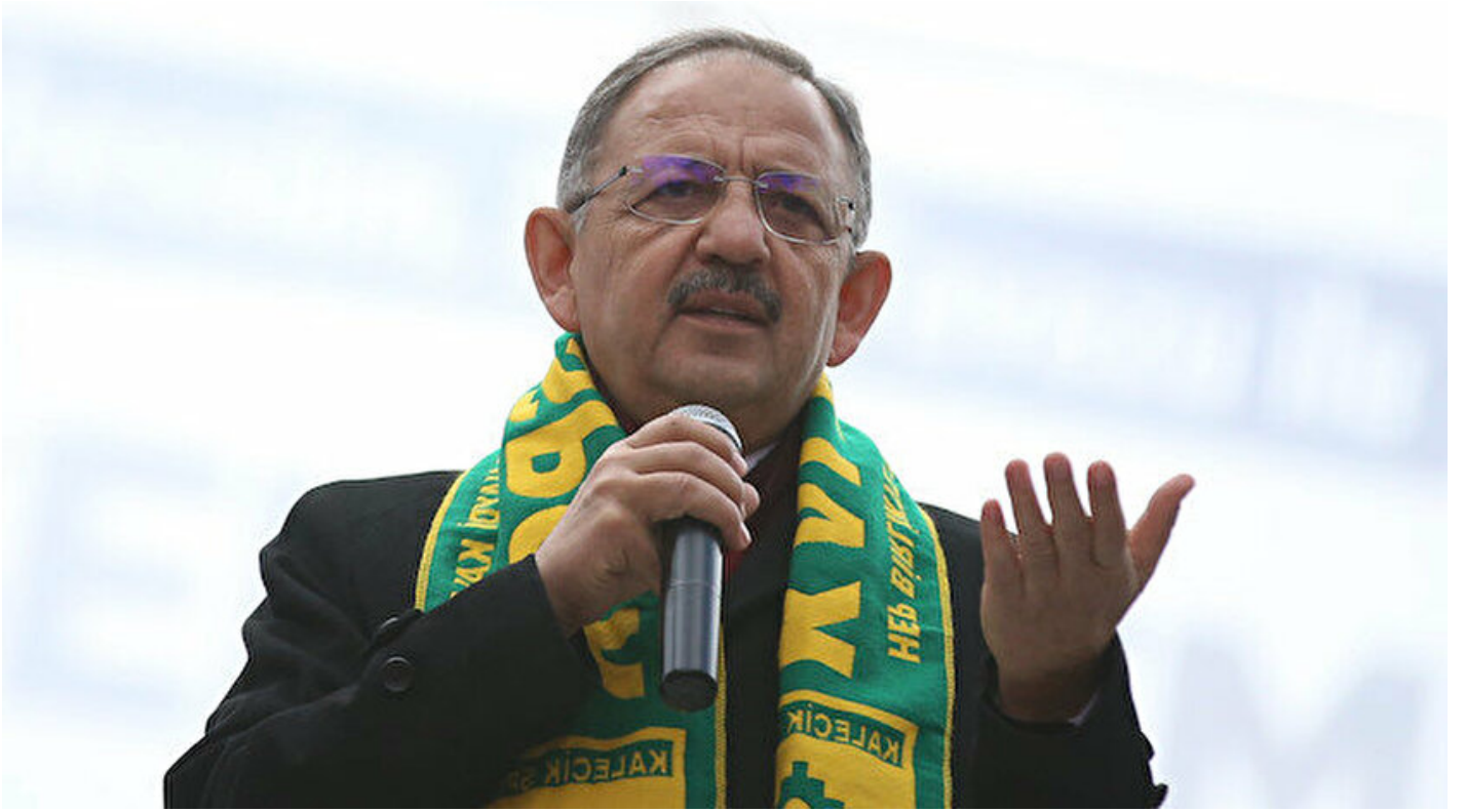
AK Parti Ankara Büyükşehir Belediye Başkan adayı Mehmet Özhaseki

Haber Merkezi · 01 Nisan 2019, 09:16 ·