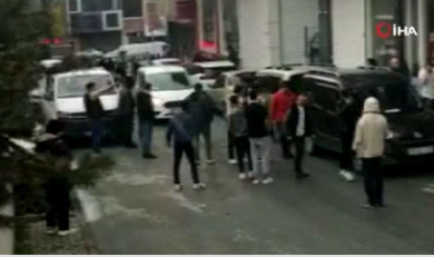
Uçan tekmeli kavga: Kaldırım taşları havada uçtu