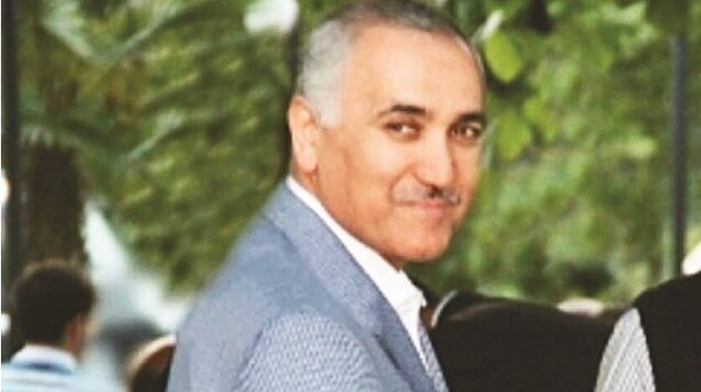
FETÖ firarisi Adil Öksüz

Haber Merkezi · 19 Haziran 2017, 04:00 · Yeni Şafak