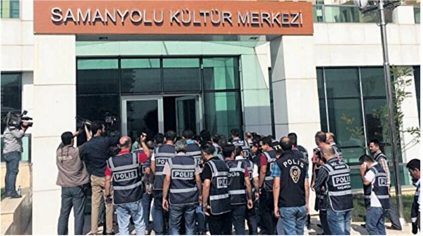
Okulda FETÖ CIA buluşmaları

Haber Merkezi · 19 Temmuz 2017, 04:00 · Son Güncelleme: 19 Temmuz 2017, 09:50 · Yeni Şafak