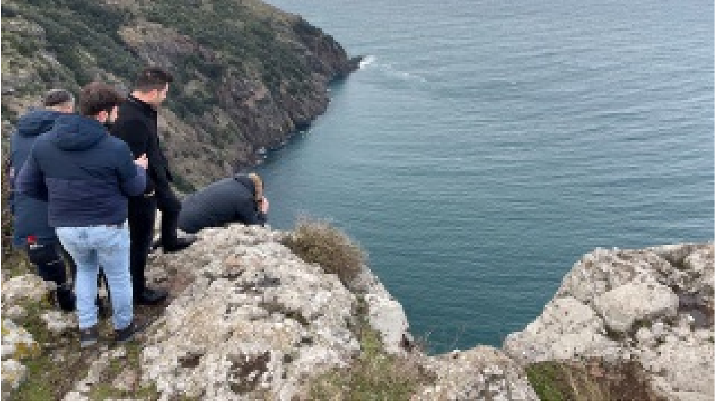
Sinop'ta uçurumda kadın cesedi bulundu