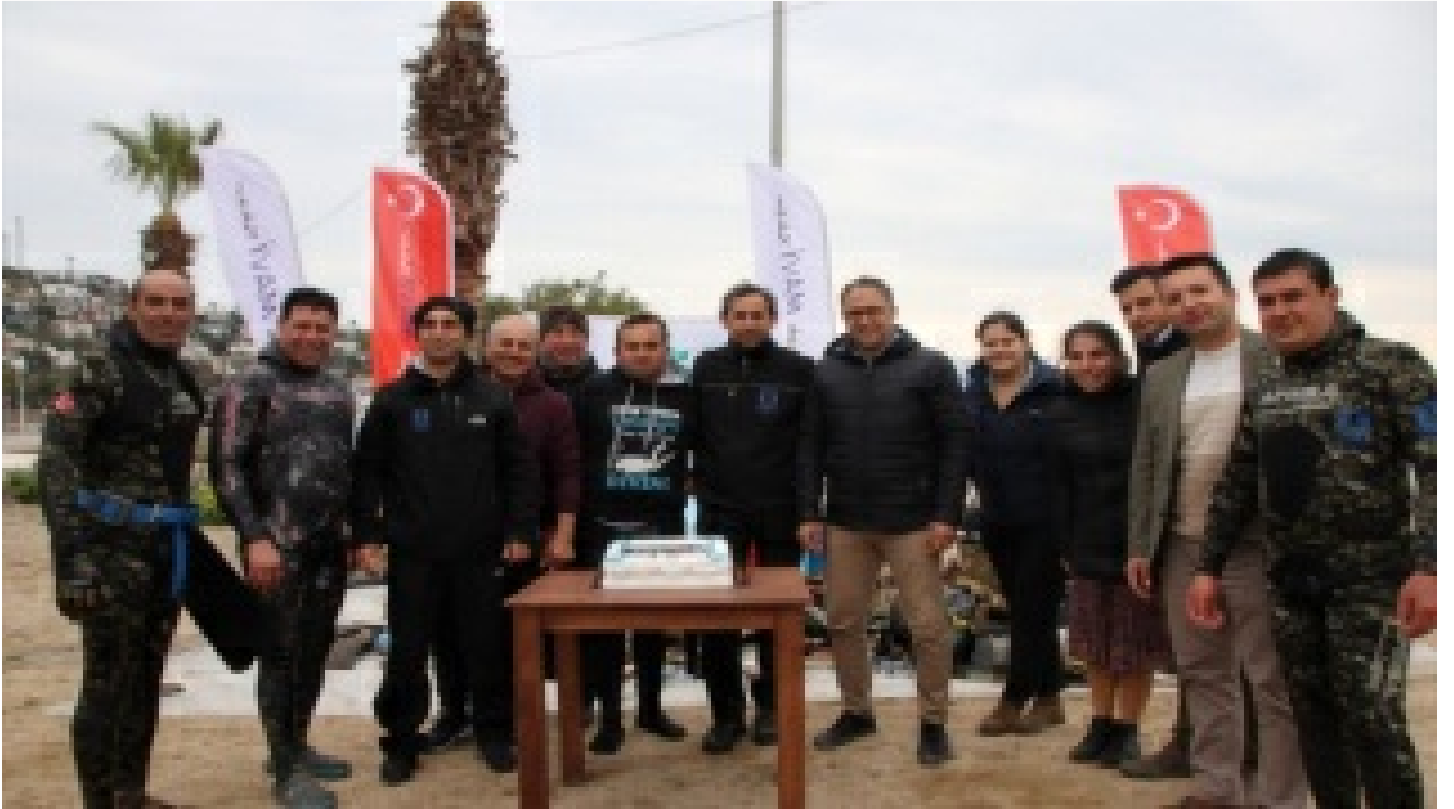
Dalgıçlar denizi, öğrenciler kıyıyı temizledi