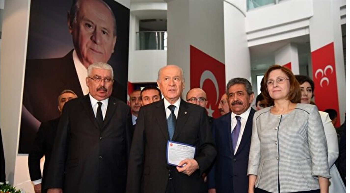
MHP lideri Devlet Bahçeli

Haber Merkezi · 02 Mayıs 2018, 10:16 · Son Güncelleme: 02 Mayıs 2018, 10:41 · Yeni Şafak