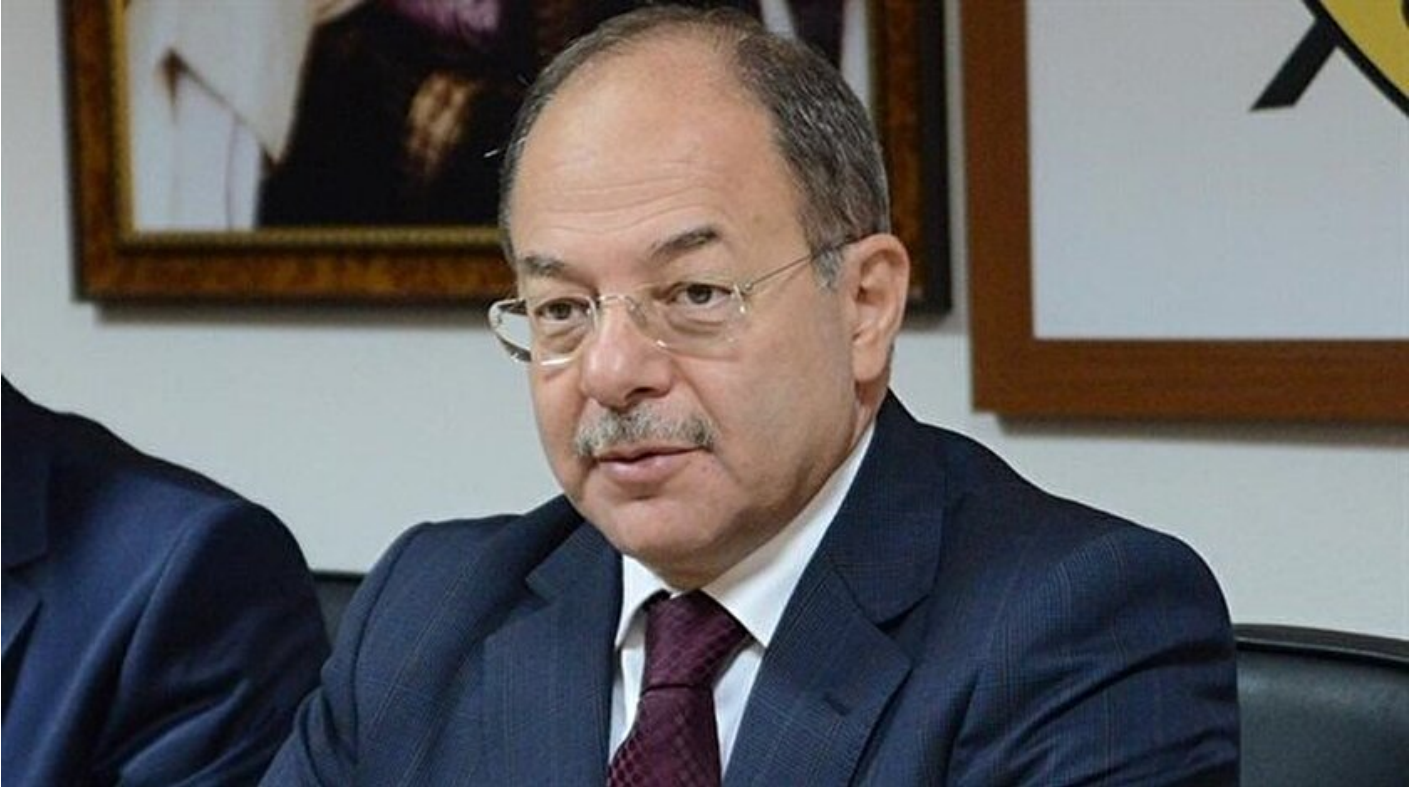
Sağlık Bakanı Recep Akdağ.

Haber Merkezi · 05 Mart 2017, 16:30 · Son Güncelleme: 05 Mart 2017, 16:31 · AA