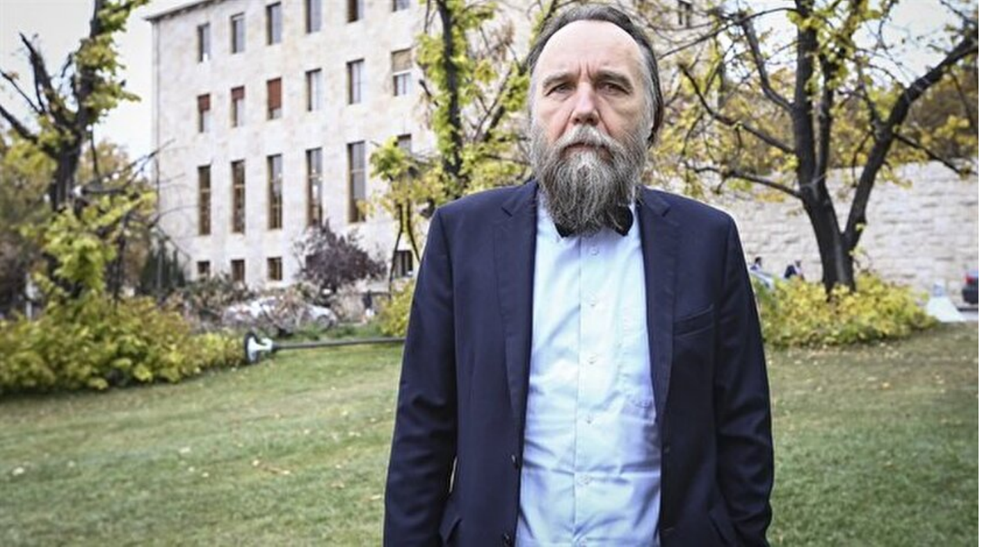
Rus stratejist ve siyaset bilimci Prof. Dr. Aleksandr Dugin

Haber Merkezi · 16 Temmuz 2018, 21:09 · Son Güncelleme: 16 Temmuz 2018, 21:26 · AA