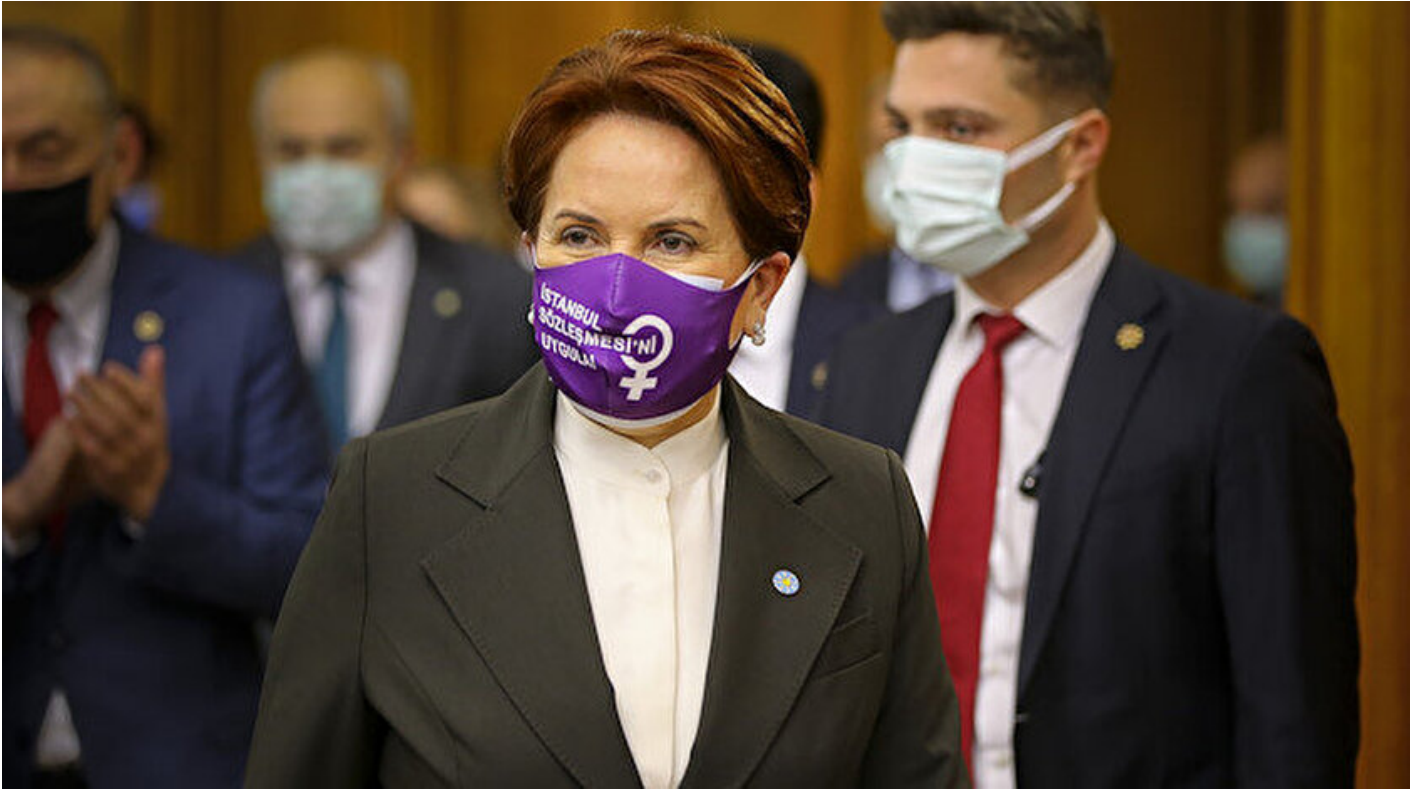
İyi Parti Genel Başkanı Meral Akşener