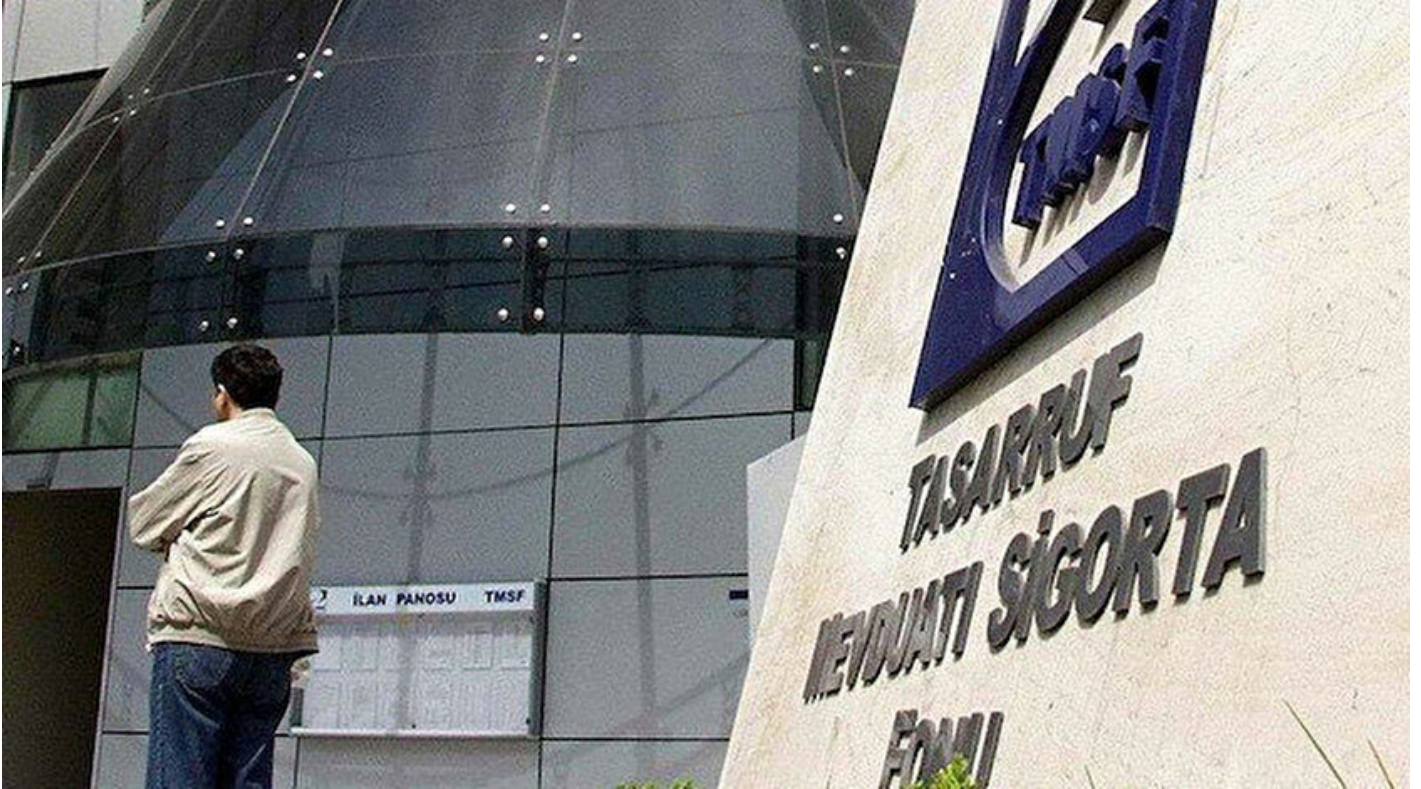
Tasarruf Mevduatı Sigorta Fonu

Haber Merkezi · 16 Eylül 2019, 15:31 · Son Güncelleme: 16 Eylül 2019, 15:39 · AA