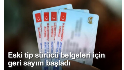
Eski tip sürücü belgeleri için geri sayım başladı