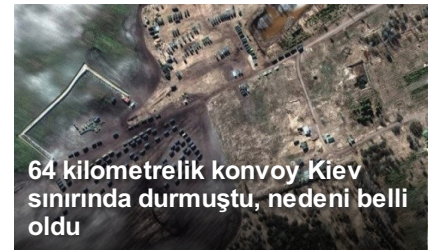
64 kilometrelik konvoy Kiev sınırında durmuştu, nedeni belli oldu