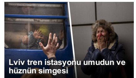
Lviv tren istasyonu umudun ve hüznün simgesi