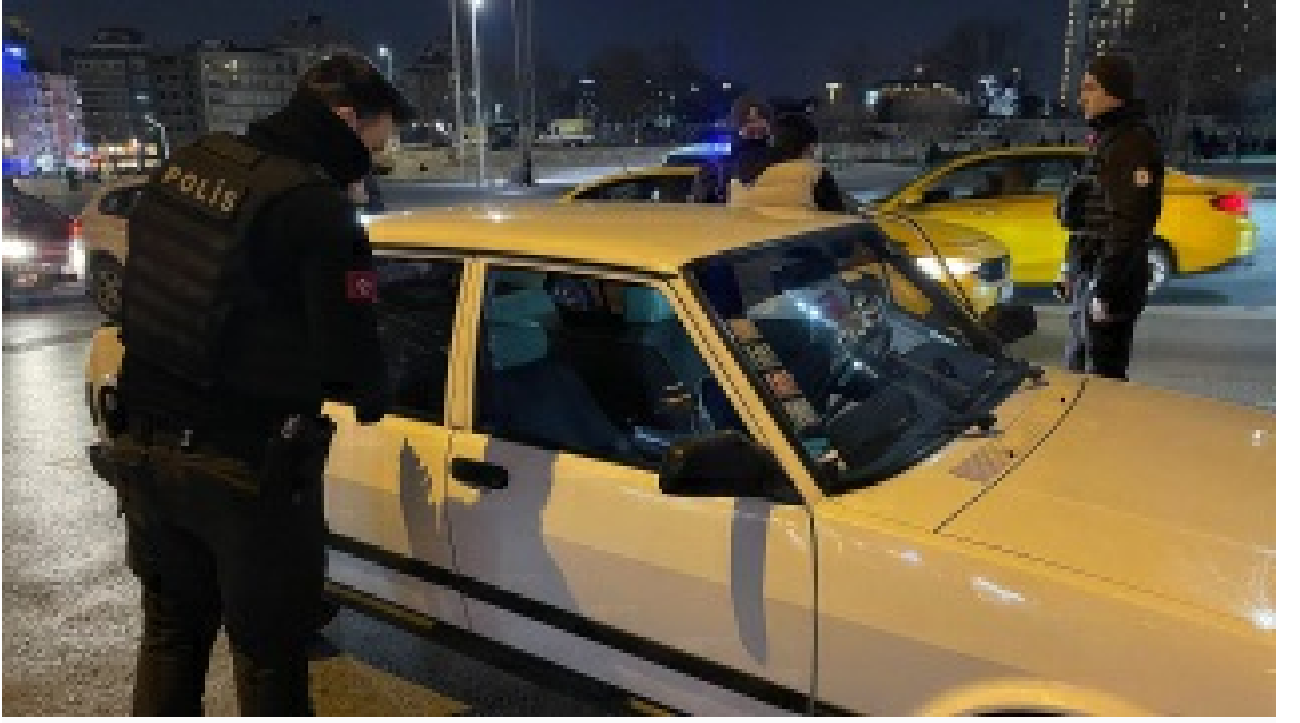
İstanbul'da "Yeditepe Huzur" asayiş uygulaması