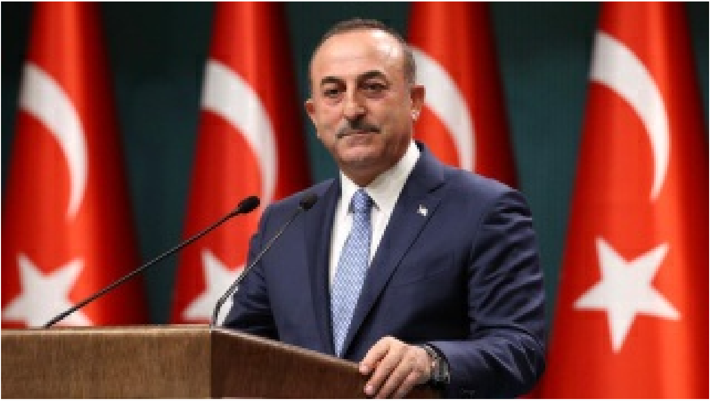
Ukrayna'dan tahliye edilen Türk vatandaşlarının sayısı 11 bini geçti