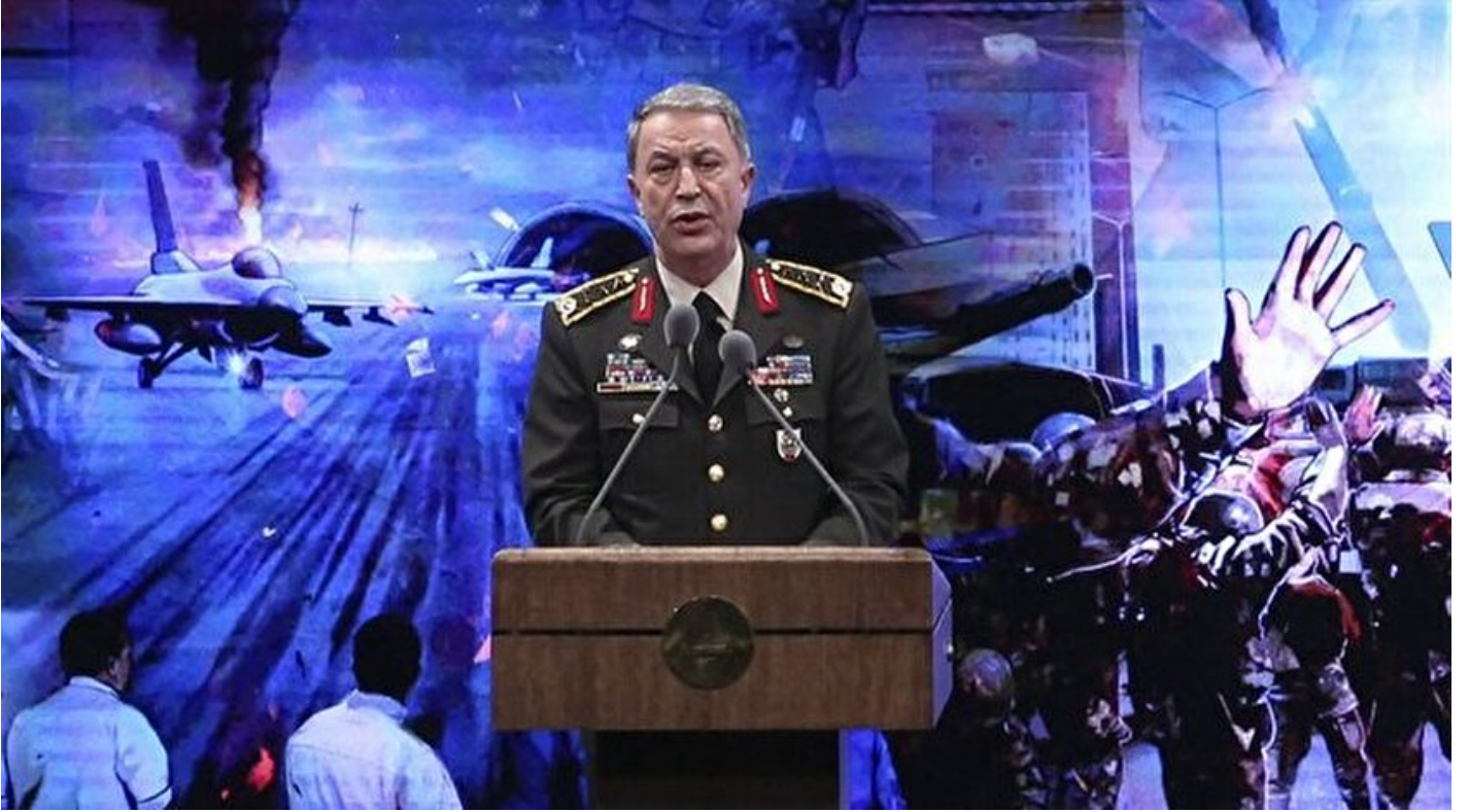
Genelkurmay Başkanı Orgeneral Hulusi Akar

Haber Merkezi · 14 Temmuz 2017, 19:46 · Son Güncelleme: 14 Temmuz 2017, 22:08 · AA