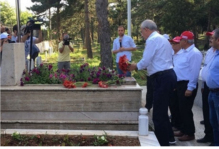
KILIÇDAROĞLU'NUN DOKTORUNDAN AÇIKLAMA