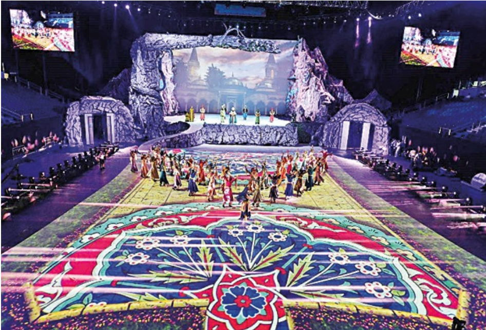
Türkçe artık onlara emanet

Bu yapı dünyanın birçok yerinde faaliyet yürüttüğü için biz kendimizi tanıttığımızda bize "Onlardan farkınız nedir" diye soruyorlar. Biz onlara 15 Temmuz'da yaptıklarını gösteriyoruz, o zaman farkımızı anlıyorlar. Böyle bir yapının dünyada bu kadar kendini gizleyebilmesi sadece Türkiye için değil diğer ülkeler için de büyük bir tehdit. Birçok ülkede devlet kurumlarıyla ilişkilerimizde zorluklar yaşıyoruz. Sonradan öğreniyoruz ki gördüğümüz kişiler onların okullarından mezun olmuş. Bütün amaçları bizi engellemek.